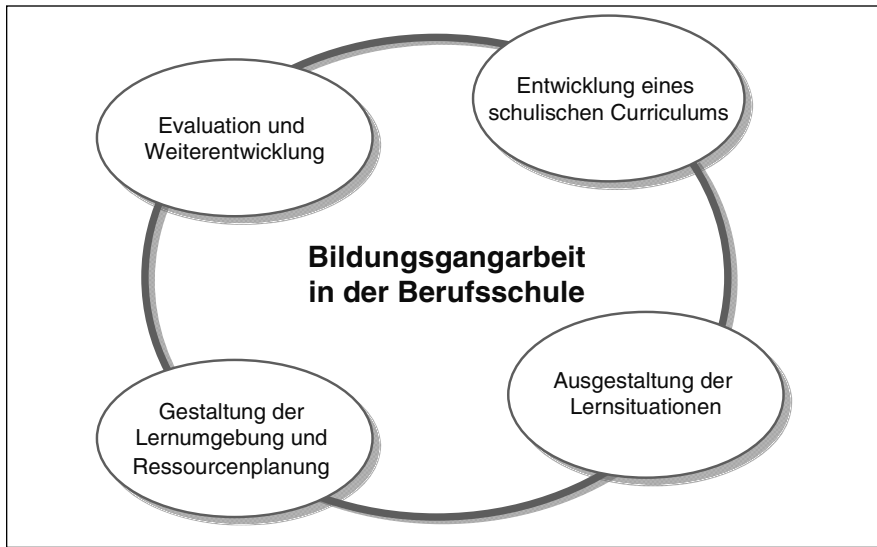
Abb. 1: Aufgaben der Bildungsgangarbeit in der Berufsschule

Diese Aufgaben lassen sich innerhalb der didaktischen Arbeit in der Schule nicht linear abarbeiten, sondern stehen in einem Implikationszusammenhang und müssen in ihrer Wechselwirkung berücksichtigt werden (vgl. Sloane 2003, S. 9). Sie werden im schulischen Alltag von Lehrerteams übernommen, die für einen Bildungsgang, d. h. die Entwicklung und Durchführung von Unterricht z. B. für einen Beruf im dualen Ausbildungssystem, verantwortlich sind. Nachfolgend wird dieses Aufgabenspektrum mit dem Begriff „Bildungsgangarbeit“ zusammengefasst. Ein solches Lehrerteam wird als Bildungsgangteam bezeichnet.