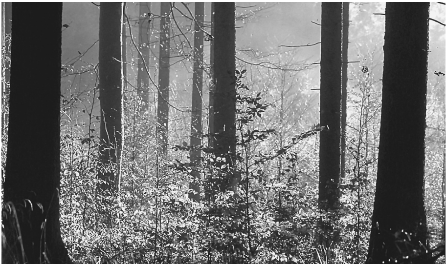
Abb. 1/3: Naturnaher Fichten-Tannen-Buchen-Wald