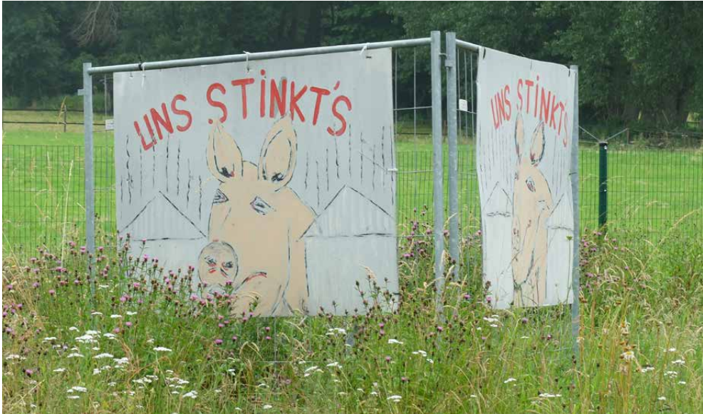
Abb. 4: Plakat in Langförden (Stadt Vechta), Juni 2021. Träger und Adressaten des Protestes sind hier nicht genannt, doch legt der Inhalt der Zeichnung nahe, dass sich das Plakat gegen Schweineställe in der Nähe von Wohngebieten richtet.

Derartige Ausmaße haben die Auseinandersetzungen in Süddoldenburg bisher nicht erreicht. Protestplakate gegen geplante Stallbauten bilden die große Ausnahme (Abb. 4). Doch auch hier hallt das Echo der anhaltenden gesellschaftlichen Kritik nach. Die befragten süddoldenburgischen Landwirte sehen sich vor allem in der öffentlich verbreiteten Meinung ungünstig dargestellt. So bildeten, wie ein Befragter aus dem Kreis Cloppenburg bemerkt, die Landwirte zwar das Rückgrat der prosperierenden süddoldenburgischen Wirtschaft, aber diese Strahlkraft der vor- und nachgelagerten Betriebe hängt nicht unbedingt auch ... bei dem Erzeuger. Also die Landwirte strahlen hier nicht so. Der Landwirt stehe dieser Wahrnehmung der blühenden Wirtschaft im Weg. So würden etwa Firmen, die Stallanlagen herstellen, als Leuchttürme der Region angesehen, die Nutzung dieser Stallanlagen für die Tierhaltung sei jedoch böse: