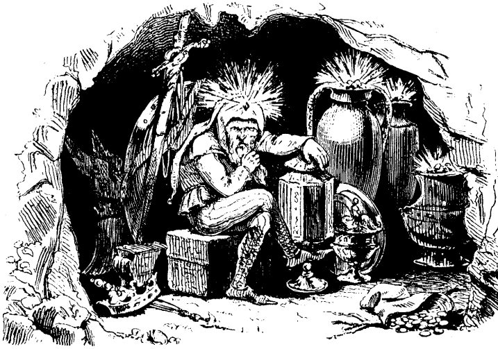
Abb. 1 Der Bergmann unter Tage – mit dem Gruß Glückauf (aus: Friedrich Schödler, Das Buch der Natur , 1846)

»Ungeflört ertönt der Berge »Irrt Zauberwort: Glück auf!«