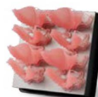
ENCÍA PARA PRÓTESIS