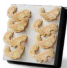
DIENTES PARA PRÓTESIS