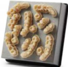
PUENTES Y CORONAS PROVISIONALES