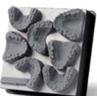
MODELOS DE ORTODONCIA CON PALADAR