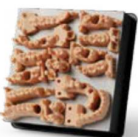
MODELOS DE CUADRANTE PARA PRÓTESIS FIJAS