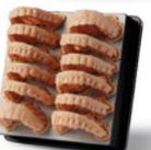
MODELOS DE ORTODONCIA CASI VERTICAL