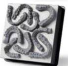
MODELOS DE ORTODONCIA PLANO EN PLATAFORMA