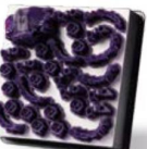
PATRONES PARA PRÓTESIS FIJAS Y REMOVIBLES