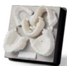
GRAN MODELO DE DIAGNÓSTICO