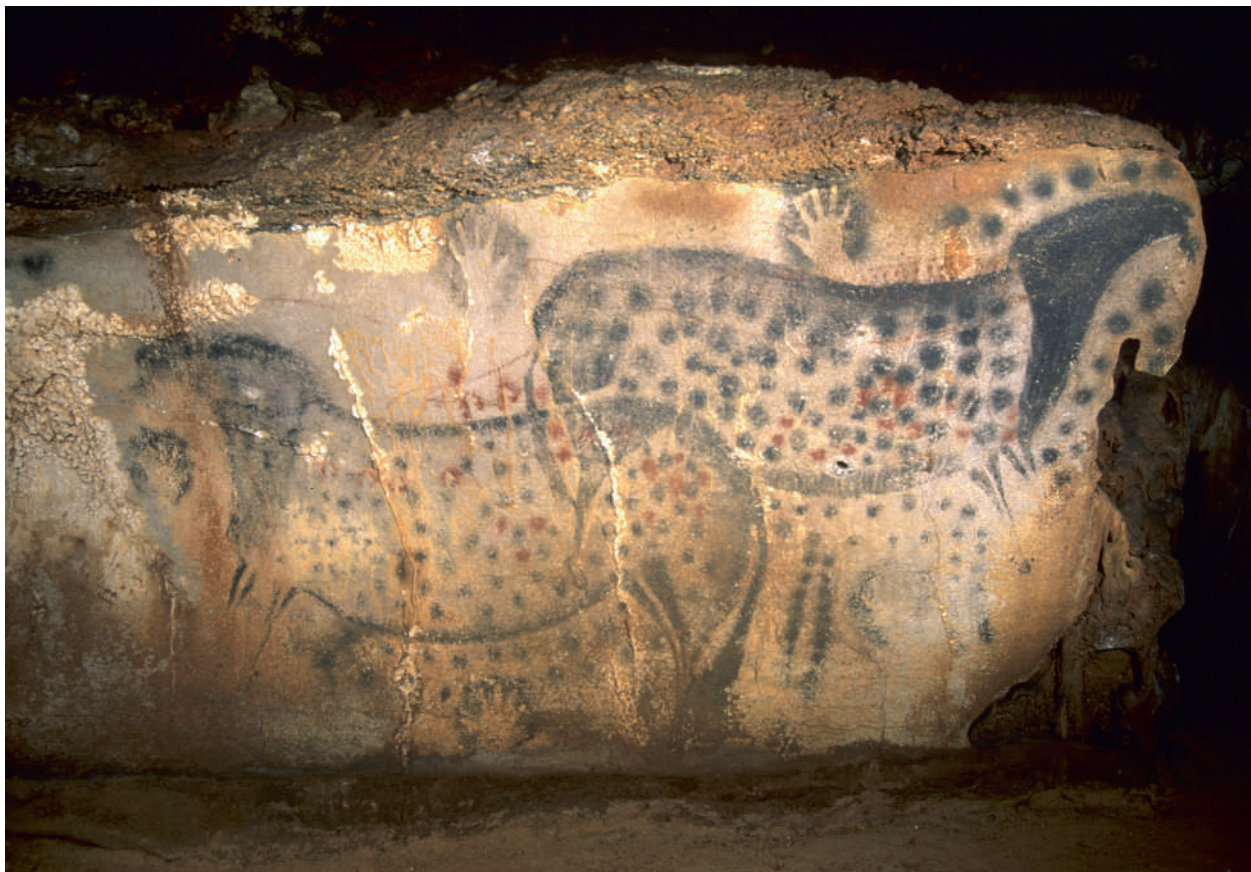
Abb. 2: Zwei gepunktete Pferde und Handabdrücke: Malerei aus Pech Merle, Département Lot, Südfrankreich, ca. 25 000 v. Chr.