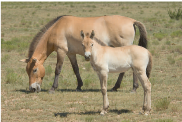
Abb. 1: Przewalski-Stute und Fohlen

Zur Gattung der Pferde ( equus ) gehören die Wild- und Hauspferde, die Wild- und Hausesel und die Zebras. Noch immer ist die Abstammung unserer Hauspferde Gegenstand von Diskussionen. Sie lassen sich wohl auf eine Wildpferdart zurückführen, die jedoch ausgestorben ist. Enge genetische Verwandtschaft besteht mit den auch heute noch existierenden Przewalskipferden (Abb. 1).