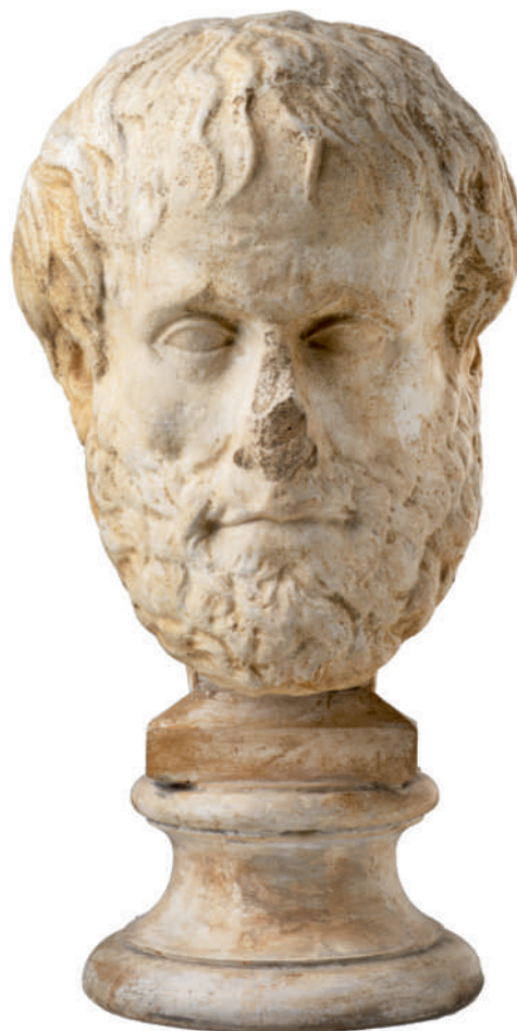
Abb. 4: Porträt des Philosophen Aristoteles, Abguss einer römischen Kopie eines griechischen Originals um 320 v. Chr.

stellungen wie etwa, dass Stuten, denen man die Haare schert, ruhiger und weniger stürmisch werden, unterstreichen das menschliche Bemühen, Pferde zu verstehen und ihre Haltung zu kontrollieren.