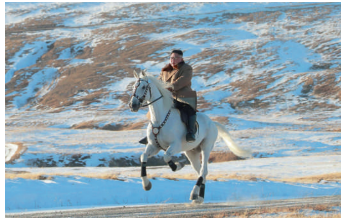
Abb. 2: Aktuelle autokratische Herrscher wie Wladimir Putin und Kim Jong Un inszenieren sich als Reiter

Einsatz wird eine Militärtechnik entwickelt, welche nicht nur ausgeklügelte konstruierte Gespanne nutzt, sondern auch das Pferd mit Ausrüstungsgegenständen versieht, welche der Handhabung und dem Schutz dienen. Trensen sind bereits aus dem Alten Orient bekannt, doch bemerkenswerterweise werden die so praktischen Steigbügel wohl zunächst von den Skythen nördlich des Schwarzen Meeres in der zweiten Hälfte des 4. Jahrhunderts v. Chr. als Schlaufen erfunden, und verbreiten sich erst im frühen Mittelalter in metallener Form.