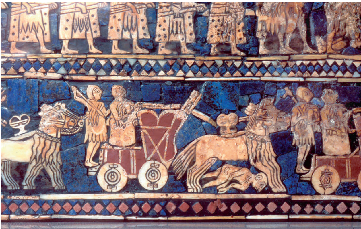
Abb. 1: Detailaufnahme eines Streitwagens, gezogen von Kungas, auf der Standarte von Ur, Südirak (2600 v. Chr.).

Sisi, das Wort für „Pferd“ im Sumerischen und Akkadischen ( sisi'um ) ist ein Wander- bzw. Kulturwort, das mit dem Tier gekommen ist und daher in verschiedene Sprachen des alten Vorderen Orients Eingang gefunden hat. Im Sumerischen wird es in der Taxonomie für Esel (ANŠE, vielleicht auch allgemein „Equide“) aufgenommen, und daraus ANŠE.KUR.RA gebildet, was „Bergesel“ bedeutet. Es gibt vereinzelte textliche Belege für Pferde aus der Mitte des 3. Jahrtausends v. Chr., aber die Belege werden erst in der Ur III-Zeit, das heißt im letzten Jahrhundert dieses Jahrtausends, häufiger. Aus dieser Zeit stammt auch die erste Darstellung eines Pferdes mit Reiter. Pferde werden damals noch nicht in Babylonien gezüchtet, sondern aus den Hochebenen des Zagros, dem kurdischen Hochland und aus Anatolien importiert. Im 1. Jahrtausend