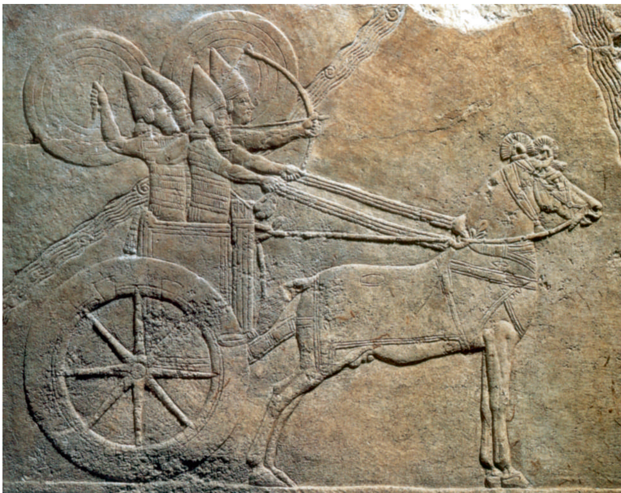
Abb. 2: Assyrischer Streitwagen, Orthostatenrelief aus dem Palast des Assurbanipal in Ninive, Nordirak, neuassyrische Zeit, ca. 650 v. Chr. Wagenpferde, in der Regel Hengste, werden speziell für ihren Einsatz in der Schlacht trainiert. Sie müssen verschiedene Gangarten vor dem Wagen lernen, sie lernen einen Ausfall, die Wende und eine komplette Drehung um 360°.

v. Chr. kommen Militärpferde für die assyrische Armee auch aus Ägypten.