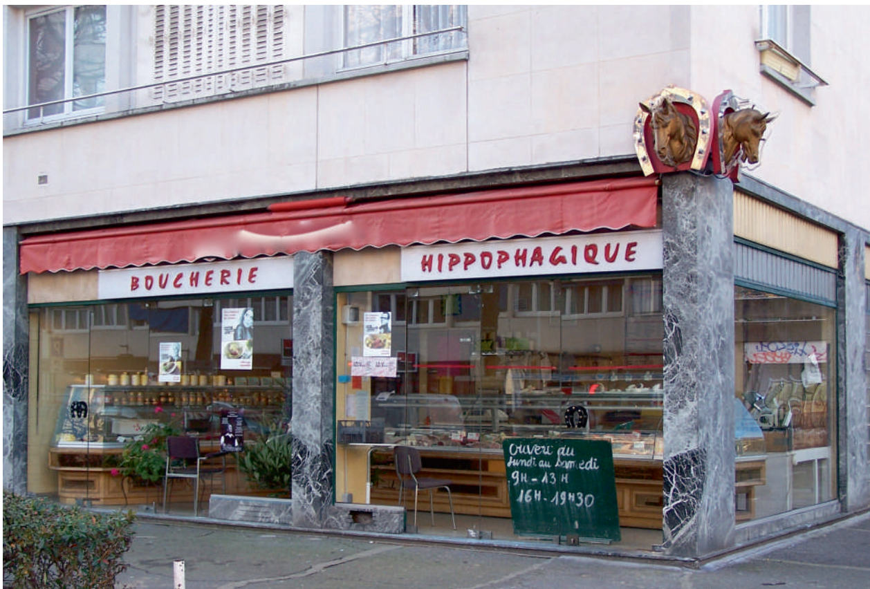
Abb. 1: Pferdemetzgerei in der Rue Glacière in Paris

Bereits in den frühesten literarischen Zeugnissen der griechischen Kultur, bei Homer, der um 750 v. Chr. die Epen „Ilias“ und „Odyssee“ verfasst, spielt das Pferd eine wichtige Rolle als Zugtier von Streitwagen und gelegentlich auch als Reittier. Pferde bekommen Namen und es wird deutlich, dass die Menschen eine intensive Beziehung zu den Tieren aufbauen, die sich nicht nur darin zeigt, dass die Pferde den Tod eines Helden beweinen, sondern auch, dass sie wie Menschen Wein zu trinken bekommen und sprechen können. Die Wertschätzung der Pferde wird auch darin deutlich, dass der Held Erichthonios vor Troja lieber seine Pferde im Stall lässt und zu Fuß in den Kampf zieht, als sie den Gefahren des Schlachtfelds auszusetzen. Dabei sind die Pferde nützliche Kriegshelfer, die, zunächst aus dem Orient als Streitwagengespanne übernommen, später auch eine hochmobile Reiterei ermöglichen, die oft schlachtentscheidend ist. Für einen solchen