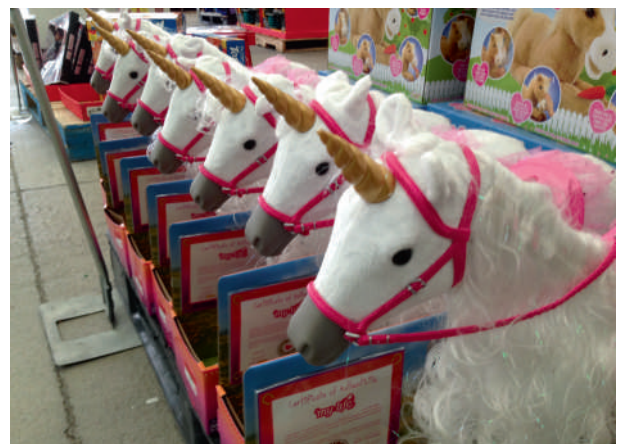
Abb. 3: Einhörner als Spielzeugtiere

Eine phantasievolle geistige Auseinandersetzung mit dem Pferd findet in den zahlreichen gesamtgriechischen Mythen statt, in denen das Pferd in Mischwesen aufgeht, seien es der geflügelte Pegasus, die Kentauren – eine Kombination von Mensch und Pferd – oder die wilden Satyrn mit Pferdeschweif. Bis heute sind solche Mischwesen wie das Einhorn, das es in der Antike in dieser Form nicht gibt, Gegenstand der modernen Popkultur und Fantasyliteratur (Abb. 3).