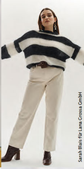
Sarah Blais für Lana Grossa GmbH