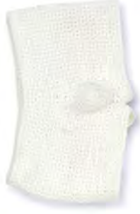
✕ BOXERSHORTS MUJI 100 % Bambusfaser