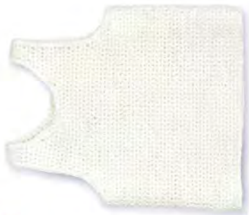
TANKTOP × Aus Bio-Baumwolle, Costes