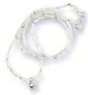
SILBERHALSKETTE MIT PERLEN × Monsieur Paris, handgefertigt in Paris