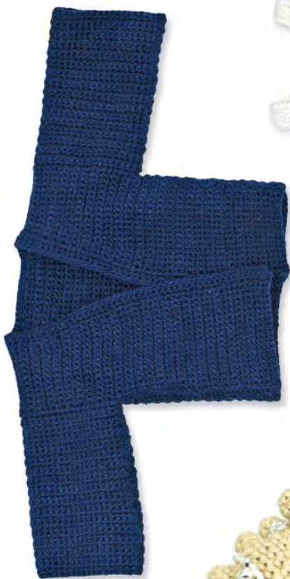
HAORI JACKE × Unisex, Muji