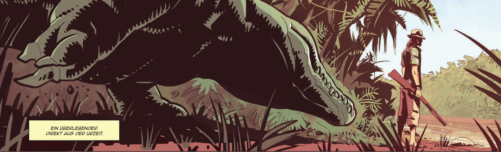
EIN ÜBERLEBENDER, DIREKT AUS DER URZEIT.