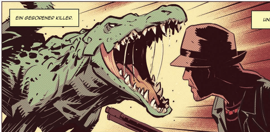
EIN GEBORENER KILLER.