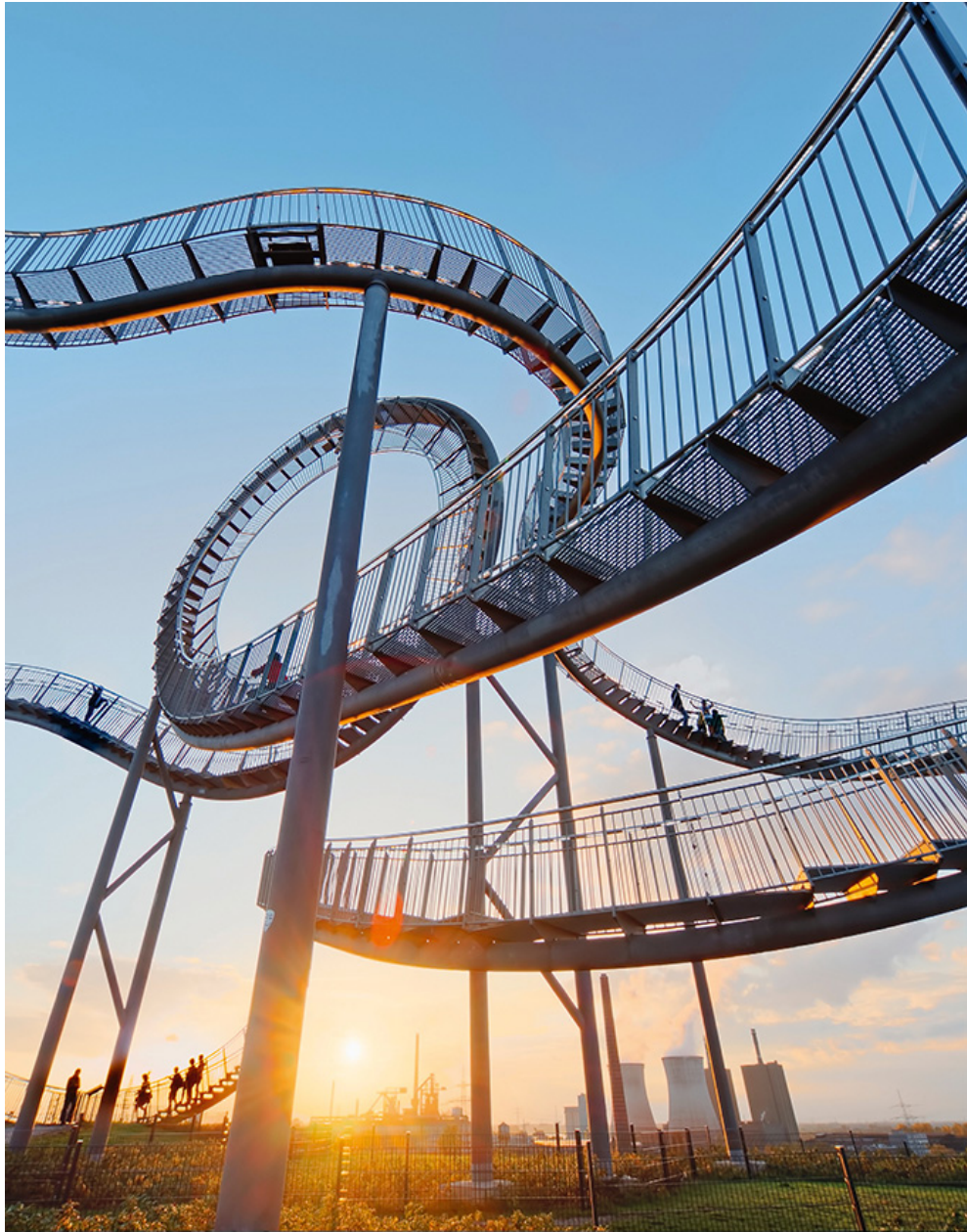
Rasant: »Tiger & Turtle - Magic Mountain« heißt diese Großskulptur im Angerpark Duisburg, die einer Achterbahn nachempfunden worden ist.