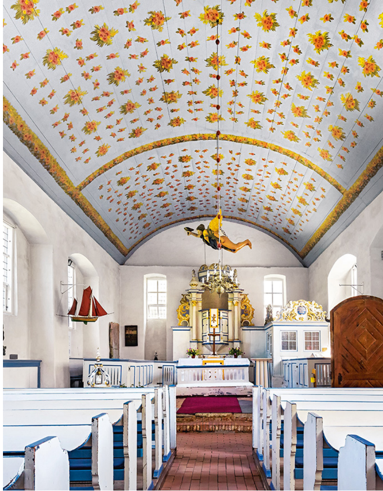
Eine Besonderheit auf Hiddensee ist die Inselkirche in Kloster mit ihrem Kanzelaltar und dem von der Decke schwebenden Taufengel, beide aus dem Jahre 1780.