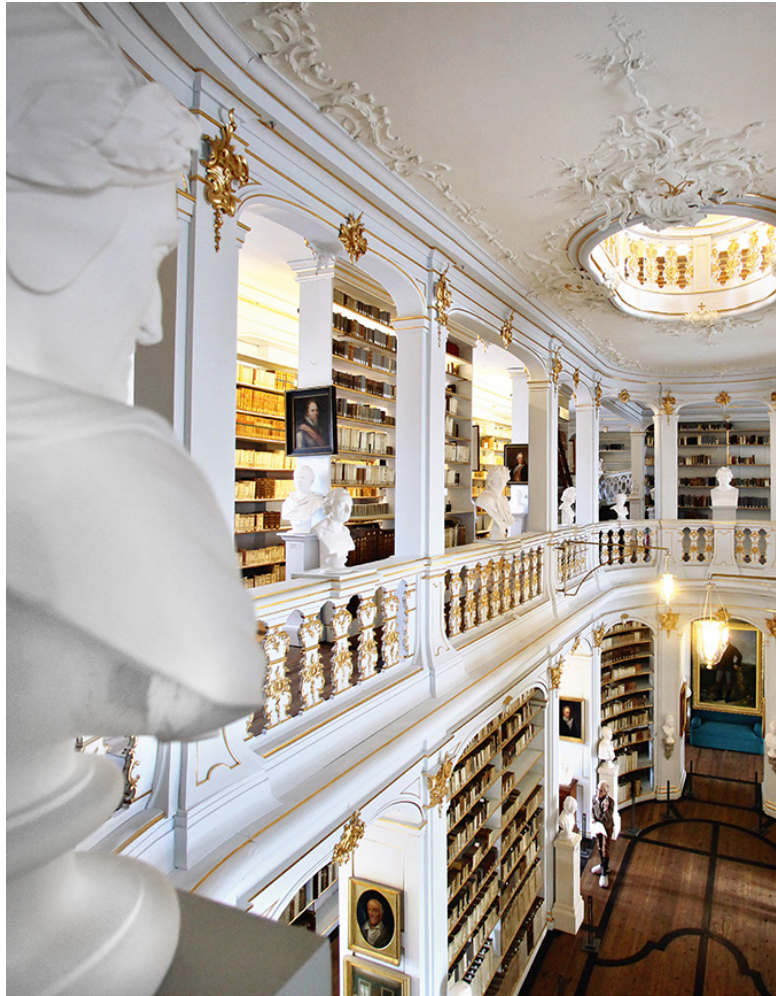
Augenweide und Wissenshort: Eine der ersten öffentlich zugänglichen Fürstenbibliotheken des Landes ist die Herzogin Anna Amalia Bibliothek in Weimar.