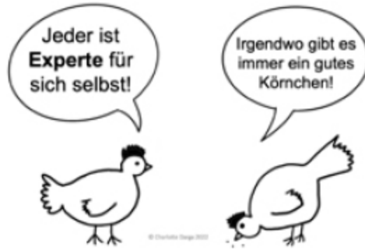
Abb. 1: Hühner

● Hühner: Sie kommen sehr gut ohne uns Menschen zurecht. Sie sind nicht auf uns angewiesen. Hühner wissen, was sie brauchen, was gut für sie ist und sorgen selbst für sich und einen bedürfnisorientierten Tagesablauf – wenn man sie lässt und ihr Lebensumfeld natürlich so gestaltet, dass sie alle Möglichkeiten dazu haben. Hühner sind also Experten für sich selbst. Diese Grundhaltung aus dem systemischen und lösungsfokussierten Ansatz, jeder sei Experte für sich selbst (de Shazer/Dolan 2020), können wir von den Hühnern besonders gut lernen bzw. mit Hilfe der Hühner lebendig vermitteln. Ebenso die positive Sichtweise auf die Dinge und der grundlegende Gedanke, dass nie alles schlecht ist. Es gibt immer Ausnahmen, Momente, die zumindest ein bisschen weniger schlecht waren oder Phasen, in denen es etwas besser lief. Hühner sind äußerst gut darin, gezielt ein gutes Körnchen zu finden, sei es auch noch so klein. Es lohnt sich also, genauer hinzuschauen!