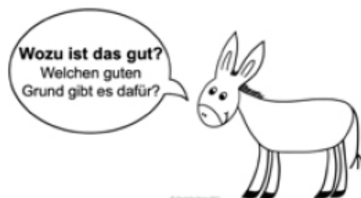
Abb. 2: Esel

● Hühner: Sie kommen sehr gut ohne uns Menschen zurecht. Sie sind nicht auf uns angewiesen. Hühner wissen, was sie brauchen, was gut für sie ist und sorgen selbst für sich und einen bedürfnisorientierten Tagesablauf – wenn man sie lässt und ihr Lebensumfeld natürlich so gestaltet, dass sie alle Möglichkeiten dazu haben. Hühner sind also Experten für sich selbst. Diese Grundhaltung aus dem systemischen und lösungsfokussierten Ansatz, jeder sei Experte für sich selbst (de Shazer/Dolan 2020), können wir von den Hühnern besonders gut lernen bzw. mit Hilfe der Hühner lebendig vermitteln. Ebenso die positive Sichtweise auf die Dinge und der grundlegende Gedanke, dass nie alles schlecht ist. Es gibt immer Ausnahmen, Momente, die zumindest ein bisschen weniger schlecht waren oder Phasen, in denen es etwas besser lief. Hühner sind äußerst gut darin, gezielt ein gutes Körnchen zu finden, sei es auch noch so klein. Es lohnt sich also, genauer hinzuschauen!