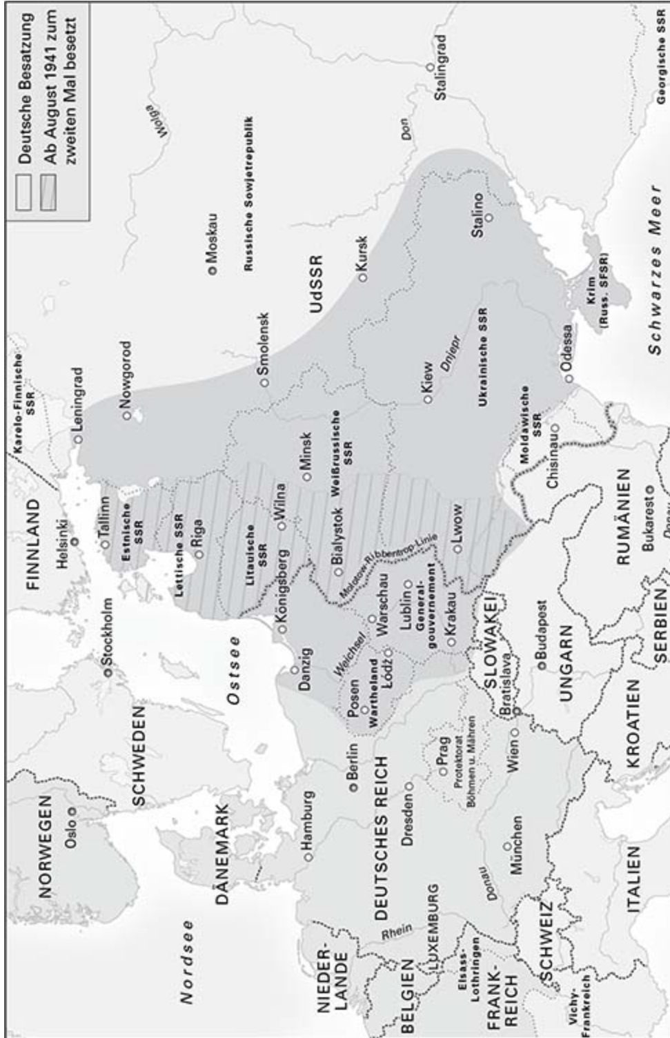
Die Bloodlands im August 1941