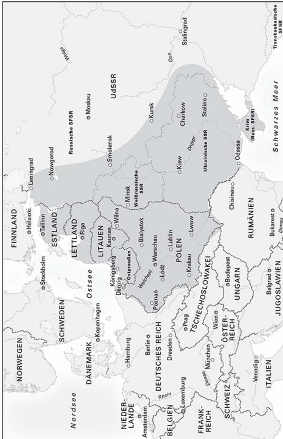
Die Bloodlands um 1933