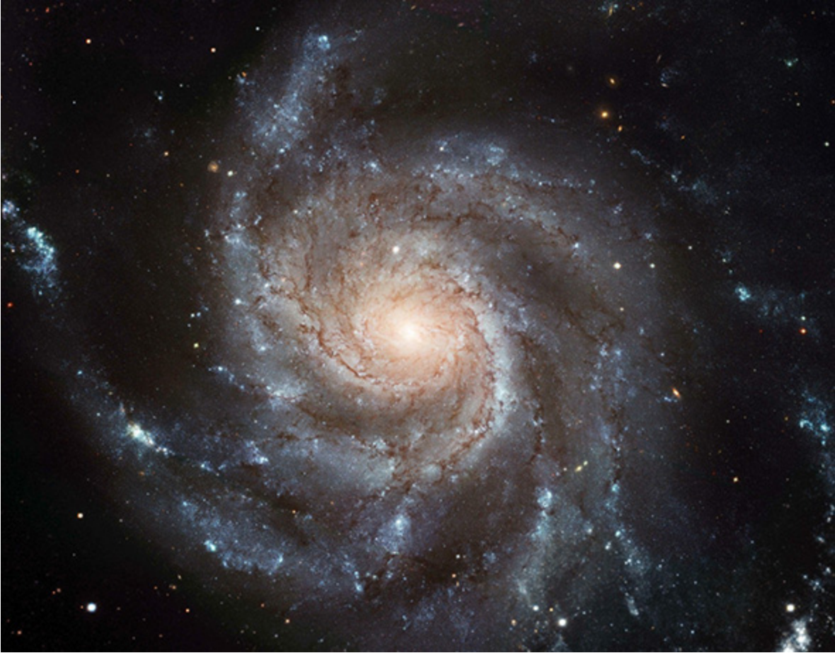
(Aufnahme einer Spiralgalaxie, wie unsere Milchstraße auch eine ist.)