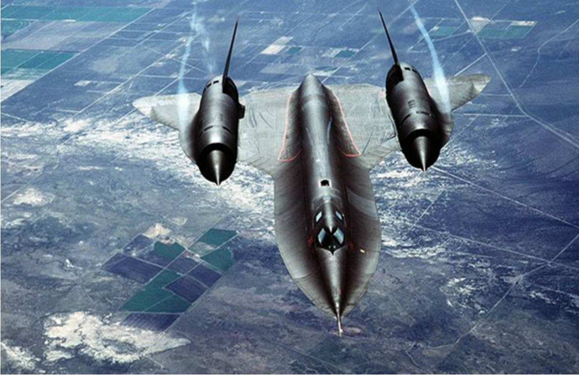
(Die Lockheed SR-71 Blackbird.)

Erdumfang. Die Erde hat einen Umfang von etwa 40.000 km. Diese Entfernung ist vorstellbar. Man braucht nur mal auf den Kilometerstand seines Autos gucken und bekommt direkt ein Gefühl dafür. Außer man fährt einen Neuwagen. Aber fast jeder weiß: 40.000 km sind fast nichts für ein Gebrauchtfahrzeug. Schließlich gibt es auch Autos die bereits 300.000 Kilometer und mehr auf dem Buckel haben. Die Zahl 300.000 ist zudem treffend für das nächste Beispiel. Denn wie ja bereits bekannt ist, ist dies die Entfernung in Kilometern, die das Licht innerhalb einer Sekunde zurücklegt. Man stelle sich nun die Erde als Ganzes vor seinem inneren Auge vor. Dazu ein gelber Lichtstrahl, der die blaue Kugel umrundet. Innerhalb einer einzigen Sekunde schafft es das Licht den blauen Planeten ganze 7,5 Mal zu umrunden.