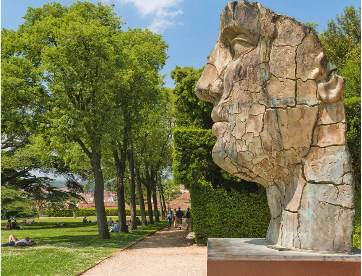
Sogar in die Boboli-Gärten von Florenz hat die zeitgenössische Kunst gefunden, ...