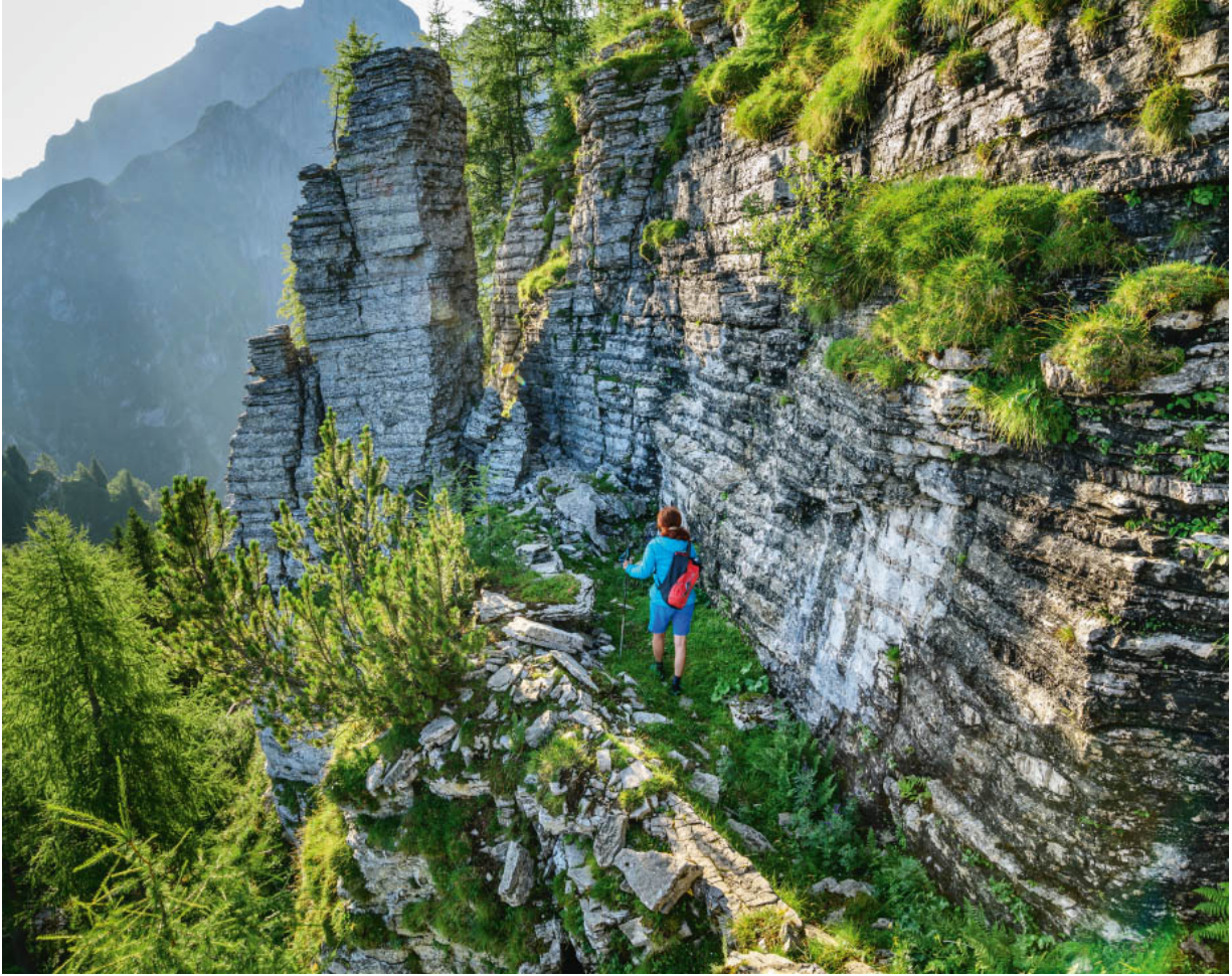
Unterwegs in den Belluneser Dolomiten