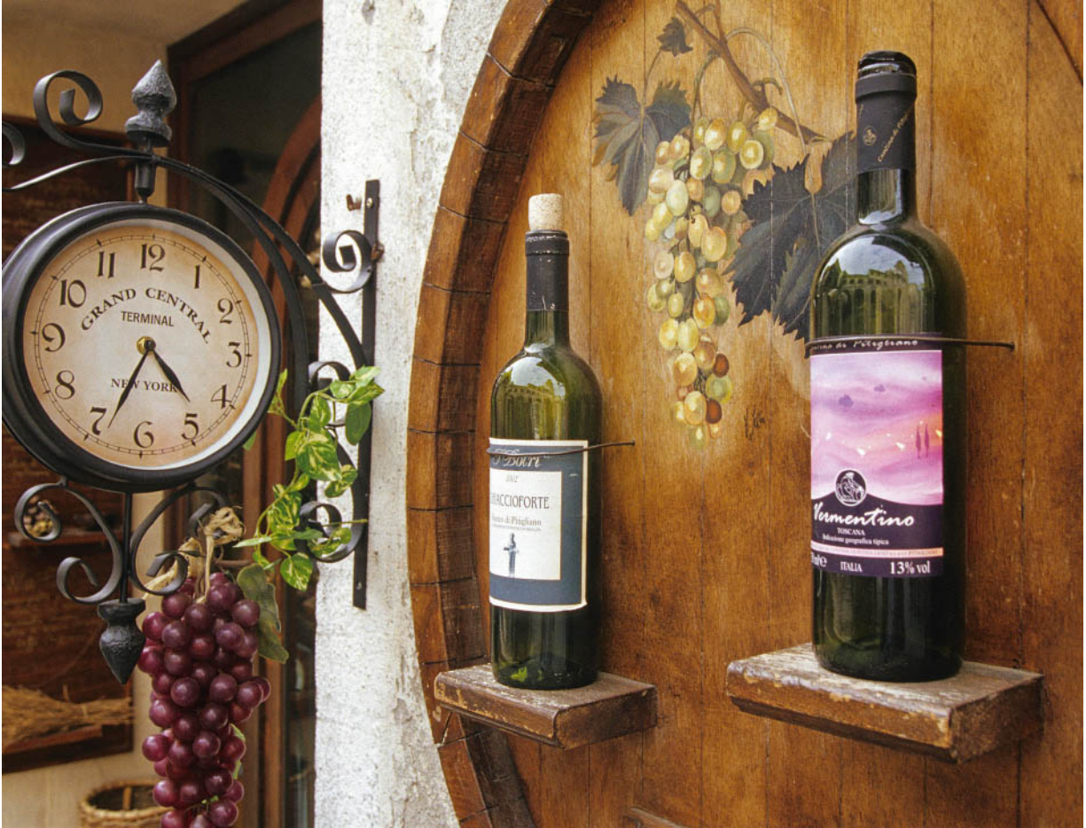
Der passende Wein macht das Essen zum Genusserlebnis.