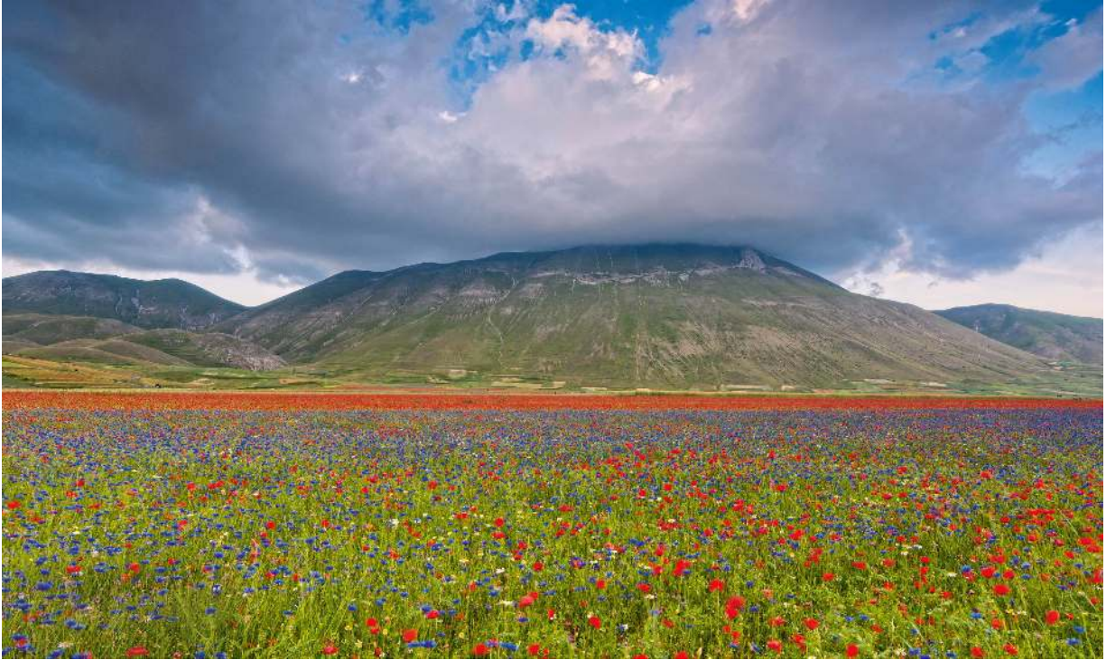
Castelluccio, eine der fruchtbarsten und schönsten Hochebenen Umbriens, breitet sich oberhalb von Norcia aus.