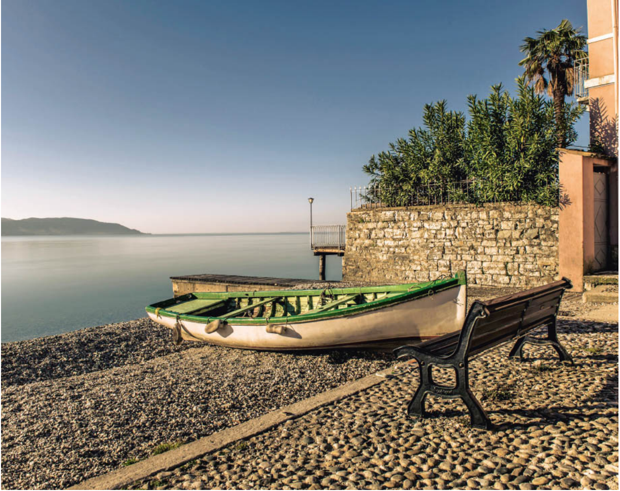
Gargnanos alter Hafen