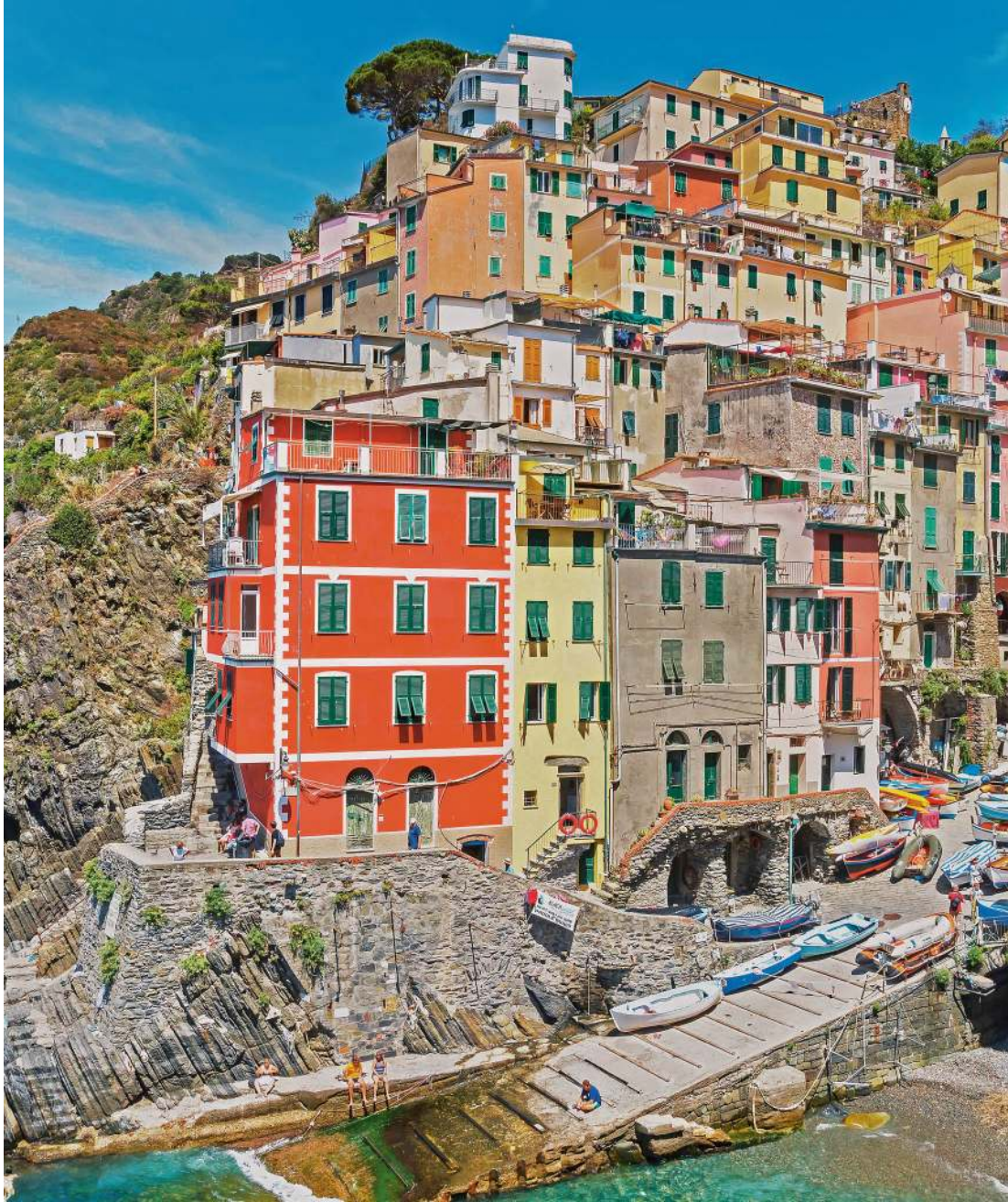
Riomaggiore, eines der fünf Dörfer der ligurischen Cinque Terre