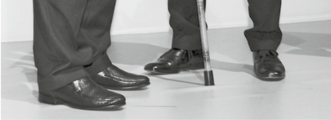
Helmut Schmidt und Siegfried Lenz, Mai 2007

Eine Freundschaft, die länger dauert als ein halbes Jahrhundert, entzieht sich in ihren Einzelheiten der Erinnerung. Was sich wann ereignet hat, ist im Rückblick nur schwer zu bestimmen. Jahreszahlen sind unzuverlässige Zeugen, und manches, was einmal wichtig war, ist längst ins Vergessen versunken. Gespräche sind nicht haltbar, sie gehören ganz dem Augenblick und lassen sich in ihrer lebendigen Bewegung Jahrzehnte später nicht mehr heraufbeschwören. Und doch setzt hier die Arbeit der Erinnerung ein. Sie stellt Stimmungen und Ahnungen bereit, die empfänglich machen. Da reift hier eine Empfindung, dort ein Gedanke, und es wächst ein sicheres Gefühl: In all der Zeit, die seither vergangen ist, hat sich die Gewissheit verfestigt, dass dieser Freundschaft unbedingt zu vertrauen ist. Sie ist mit den Jahren gewachsen und wurde zu einer verlässlichen Größe. Sie ist mit den Freunden alt geworden, so alt, dass die beiden sich heute nicht ganz ohne Rührung begegnen können. So viel