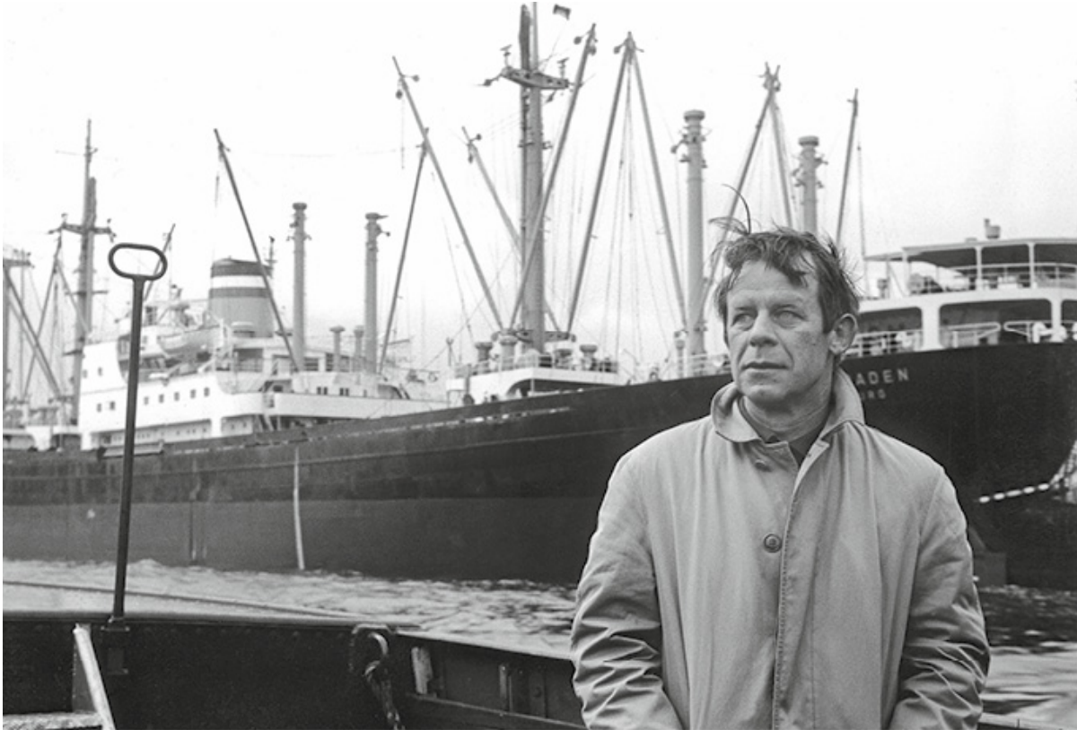
Siegfried Lenz im Hamburger Hafen, 1960er Jahre

»Als verlockendster Anfang böte sich natürlich der Befehlsstand der Hamburger Polizeizentrale an«, schrieb er drei Jahre später in einem Porträt über Helmut Schmidt: »Die Hansestadt ist vom Hochwasser eingeschlossen, Innensenator Schmidt hat das Kommando übernommen, prüft die Lage und die Veränderungen der Lage, lässt sich Vortrag halten von Generalen und Admiralen und trifft seine Entscheidungen bei Zigaretten und Kaffee. Man könnte da die Sprache der Katastrophe sprechen lassen, könnte die Verwandlungen eines Gesichts in den Nächten der Entscheidung beschreiben, auch ließe sich auf