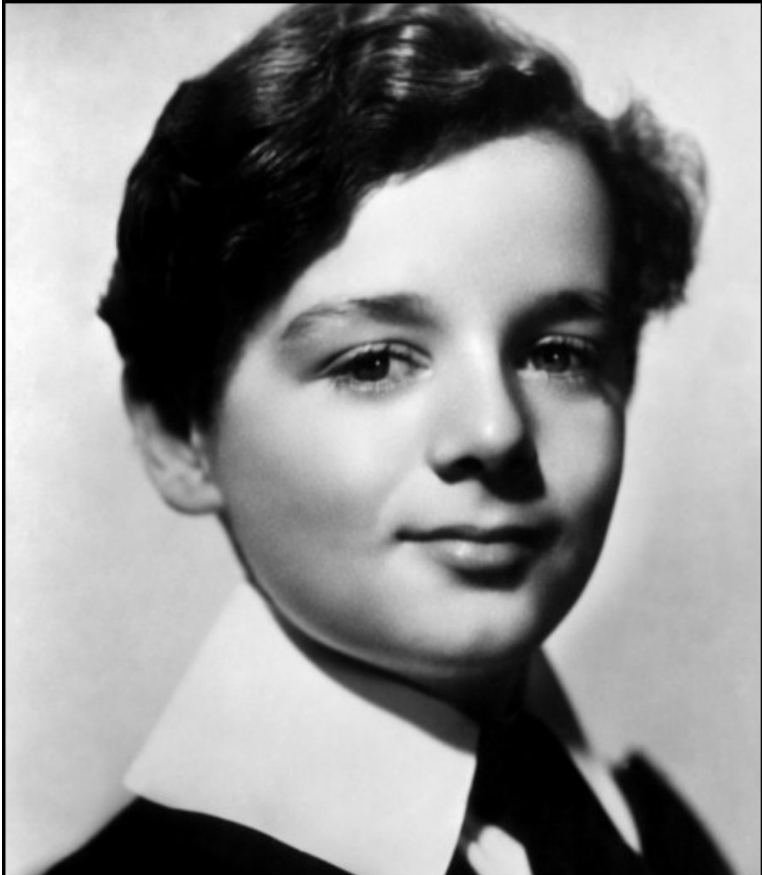
Freddie Bartholomew als Cedric "Ceddie" Errol

»Herzlieb«, sagte Cedrik – so hatte sein Papa sie immer genannt, und der kleine Junge machte es ihm nach – »Herzlieb, geht's Papa besser?«