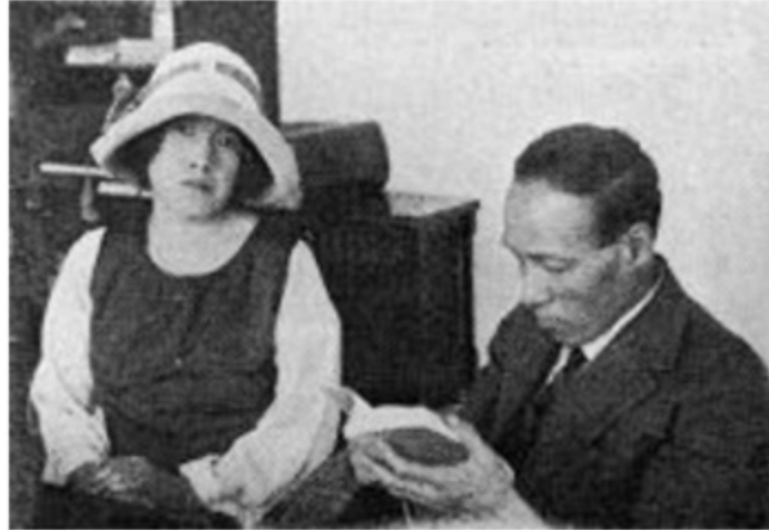
Yosano Akiko og Tekkan

Som et led i forsøget på at promovere tanka , det "nye" waka, besøgte Yosano Tekkan byerne Kyoto og Osaka, hvor han afholdt workshops og underviste i sine reformtanker. Det var på en sådan workshop i Osaka, at Tekkan mødte Akiko i august 1900. Han bemærkede straks hendes enestående talent, og Akiko blev snart fast leverandør af tanka-digte til tidsskriftet Myojo . De to digtere indledte også et kærlighedsforhold, selv om Tekkan på det tidspunkt allerede var involveret i flere andre forhold og i henholdsvis 1899 og 1900 blev far til børn født af to forskellige kvinder. I 1901 flyttede Akiko til Tokyo, parret blev gift, og senere samme år udkom Yosano Akikos berømte samling af 399 tanka, Midaregami ("Filtret hår"). Bogen chokerede offentligheden og kritikerne på grund af den lidenskabelige individualisme og den ligefremme skildring af en kvindes erotiske følelser. Digtene udfordrede både de æstetiske normer og de patriarkalske værdier i det japanske samfund og blev en stor inspirationskilde for datidens fremspirende kvindebevægelse.