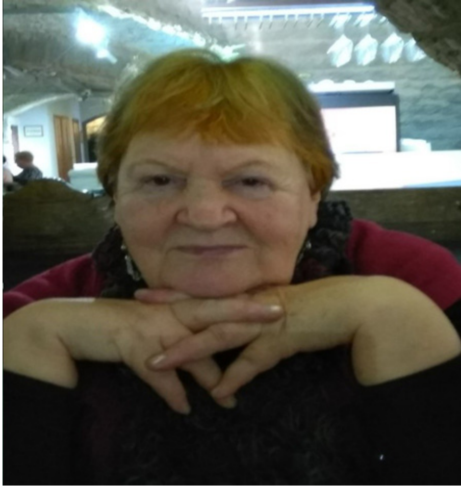
Rea ja Lea kirjoittelee tunnelmista