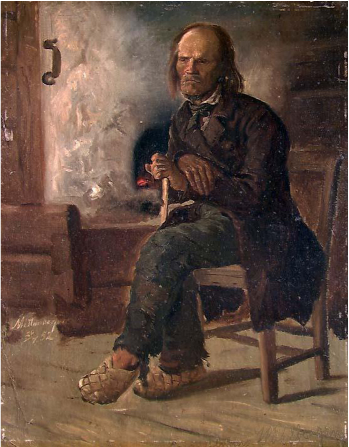
Mann fra Finnskogen i Värmland. Malt av Adolph Tidemand. Røykovnen kan ses i bakgrunnen.