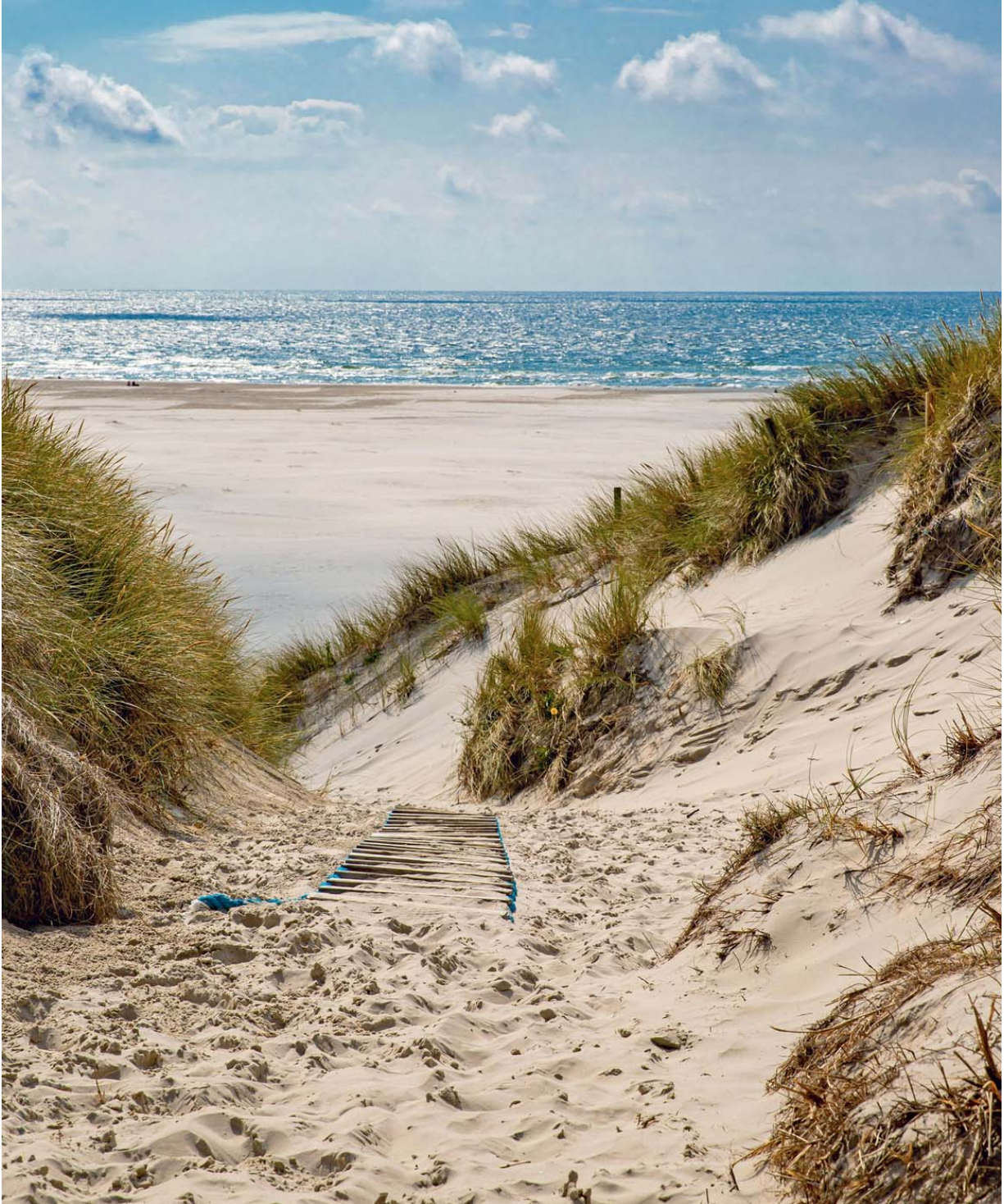
Wunderschöne Nordseeidylle auf der Insel Amrum, die zu den Nordfriesischen Inseln gehört (2).