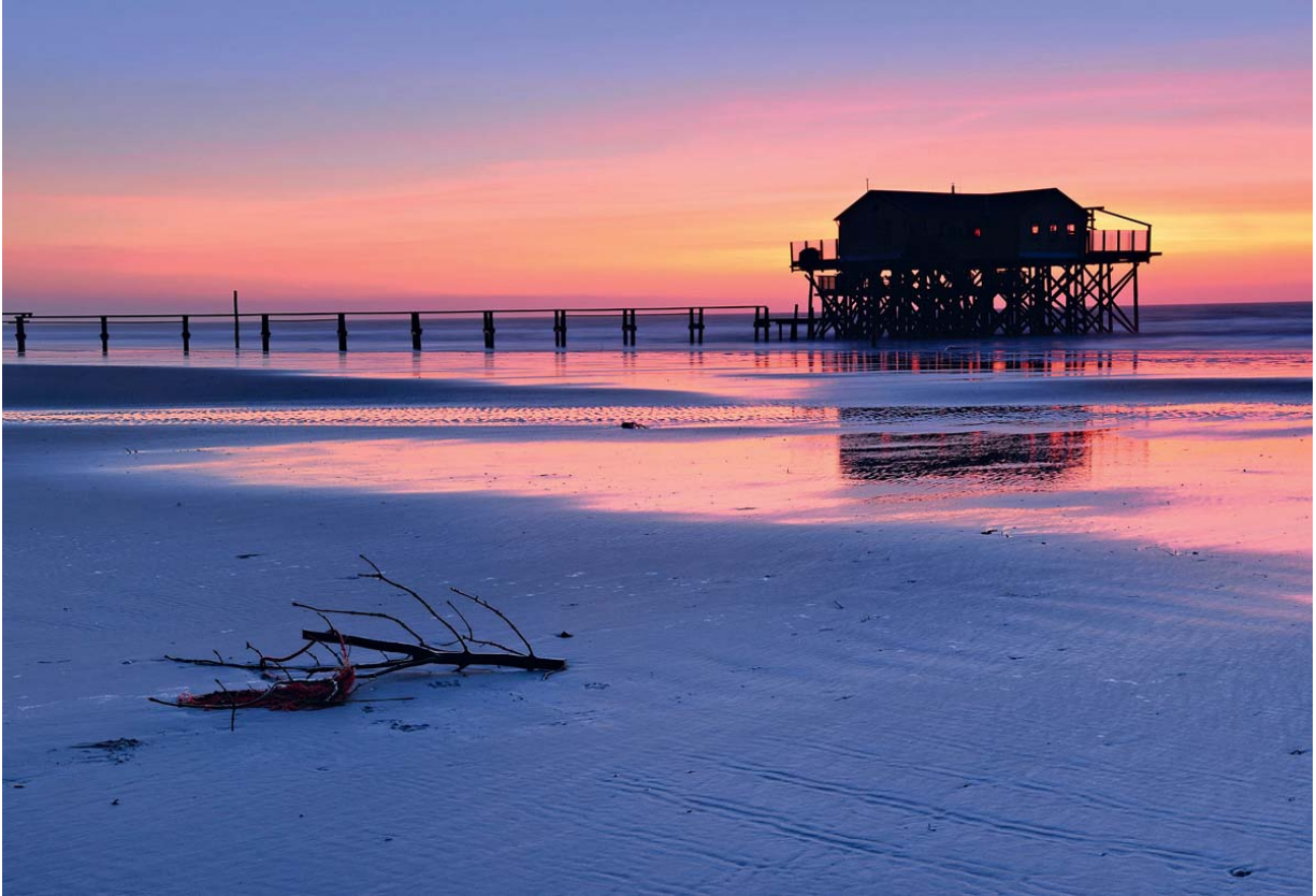
Am Strand von Sankt Peter-Ording stehen Pfahlbauten zum Schutz vor Wind und Wetter.