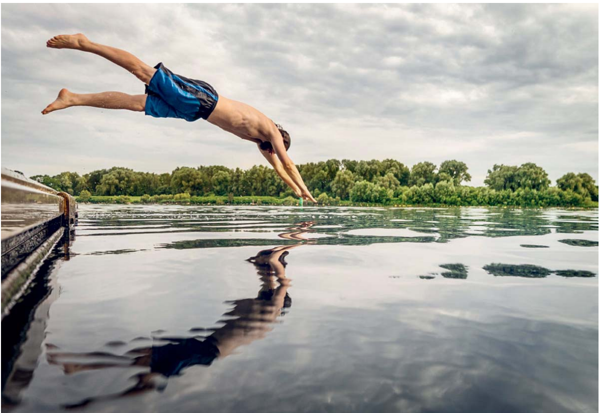
Herrlich erfrischend, so ein Sprung ins kühle Nass!