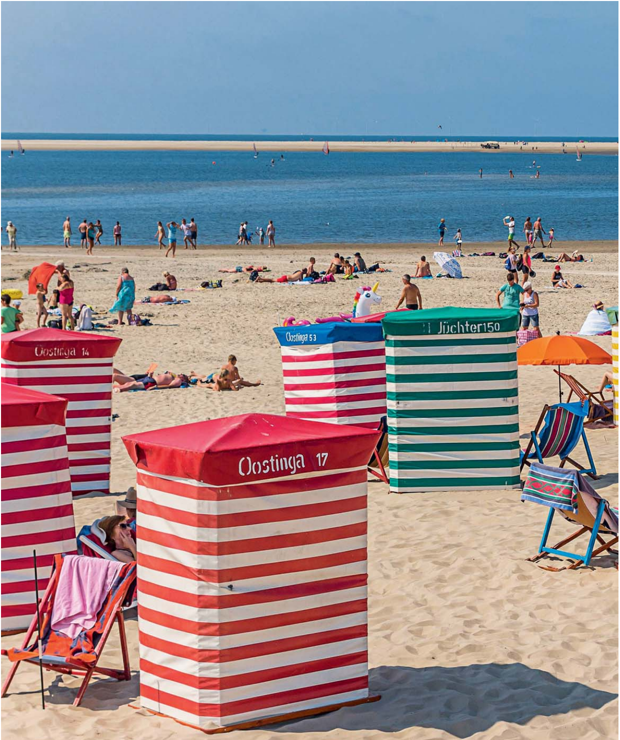
Mal was anderes: Auf Borkum gibt es nicht nur Strandkörbe, sondern auch Strandzelte, die man mieten kann. Die aufgedruckten Namen stehen für den Verleih oder Besitzer. Gegenüber blickt man zur Seehundbank »Hohes Riff«.