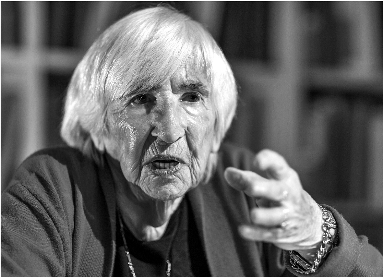
Esther Bejarano bei einem Zeitzeugengespräch im April 2015 in der Christuskirche in Fulda

Wie diese Rache aussehen konnte, wusste sie damals noch nicht. Es waren auch keine Rached Gedanken gegen einzelne Nazis, Rached Gedanken hegte sie gegen das System.