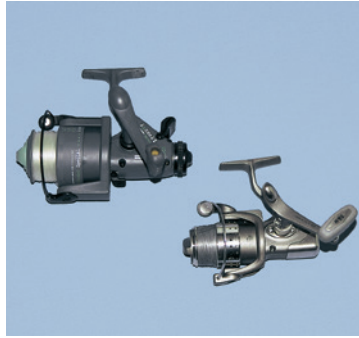
Freilaufrolle (links) im Vergleich zur normalen Stationärrolle.

Für fast alle Belange des Raub- und Friedfischangelns reichen Stationärrollen der Größe 2 bis 3 (zu erkennen an ihrer Typenbezeichnung, die meist mit 2000 oder 3000 endet). Diese Rollen passen zu den oben empfohlenen Ruten. Wichtig ist eine gut justierbare Bremse und eine reibungslose Schnurverlegung. Alle modernen Rollen ab einer Preisklasse von etwa 80 Euro erfüllen diese Voraussetzungen. Die meisten Rollen werden mit zwei Spulen (Wechselspulen) geliefert. Wenn eine der Spulen mit monofiler 0,25er und die andere mit 0,30er bewickelt ist, hat man die für das Grundangeln an den meisten Seen, Flüssen und Bächen stets richtige Schnurstärke auf der Rolle. Wer oft an Flüssen angelt, ist gut beraten, eine der