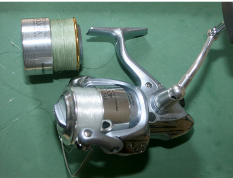
Rollen mit zwei Spulen sind ideal, um auf unterschiedliche Bedingungen reagieren zu können.

beiden Rollen als sog. Freilaufrolle anzuschaffen, denn sie erlaubt Grundangeln mit geöffnetem Schnurfangbügel, was bei herkömmlichen Rollen nur in stehenden Gewässern möglich ist. Die zweite Rolle sollte für den Einsatz als Spinnrolle angeschafft werden (siehe Kapitel Spinnfischen).