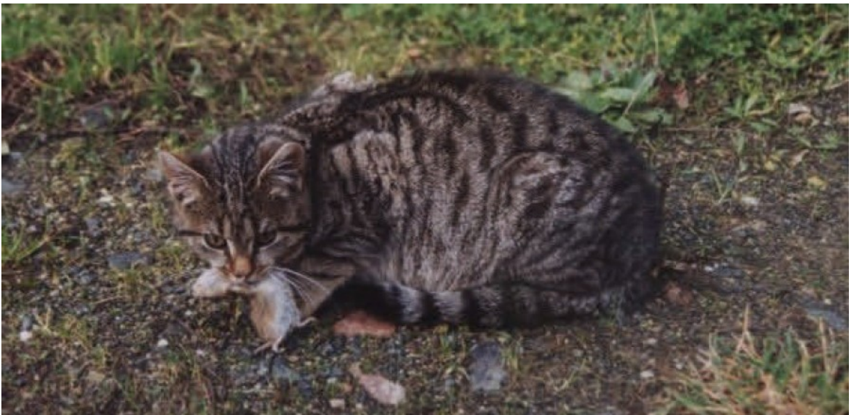
Mimmi mit Maus.

Mimmi war nicht viel älter als ein Jahr als wir sie kennen lernten. Sie lebte auf einem Vierseithof in einem kleinen Dorf etwa 10 Kilometer von der bereits geschilderten Doppelhaushälfte entfernt. Meine Frau und ich lernten sie kennen, weil wir den Hof kauften und Mimmi mit übernahmen. Als wir sie zum ersten Mal sahen, war Sommer und diese graugetigerte Hübsche sprang vergnügt auf der Wiese daher und war zutraulich zu allen. Auffällig war, dass sie viel „redete“. Sie gab nicht nur Töne von sich, die wir von Katzen kannten, sie konnte vergnügte und grantige Töne von sich