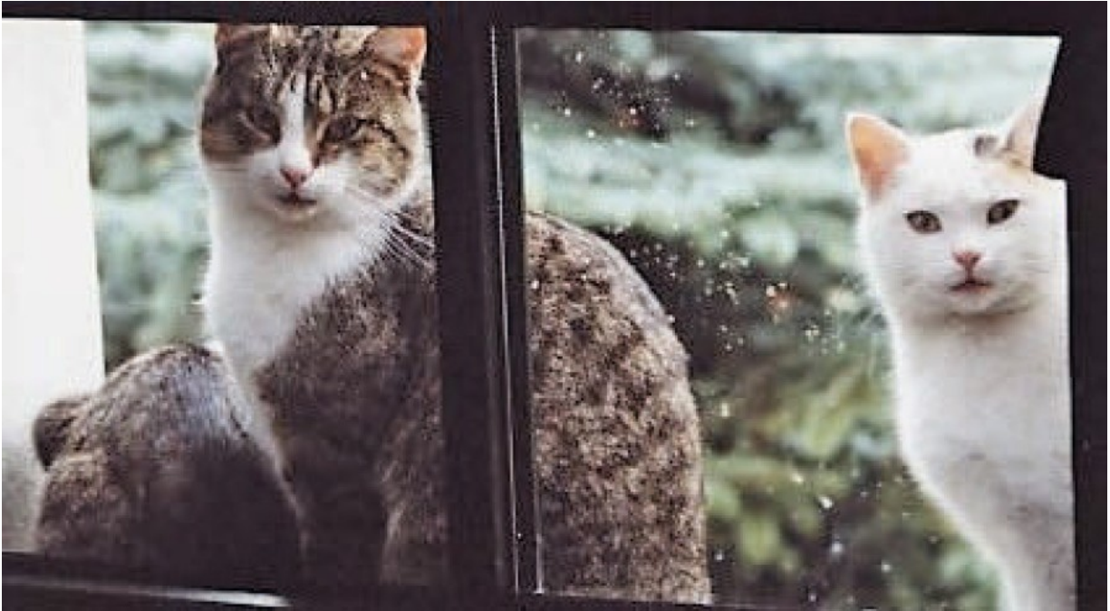
Kini und Butzi am Fenster, links daneben Sophie.

Kater, auch wenn er – und das ohne Kastration – alle Verhaltensmerkmale eines Mädchens aufwies. Aus der ursprünglichen Sissi wurde also der Kini. Er war zurückhaltend gegenüber den Geschwistern und scheu uns gegenüber. Er konnte nie festgehalten oder hochgehoben werden. Eine Sterilisation war somit außerhalb der Möglichkeit. Vermutlich hatte er als potenter Kater Einfluss auf den weiteren Zuwachs um und auf dem Hof.