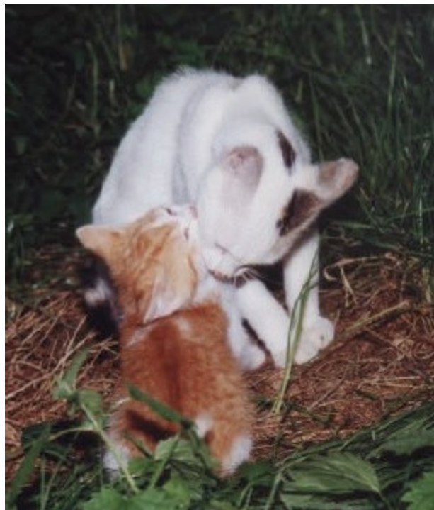
und putzt ihren Dori.