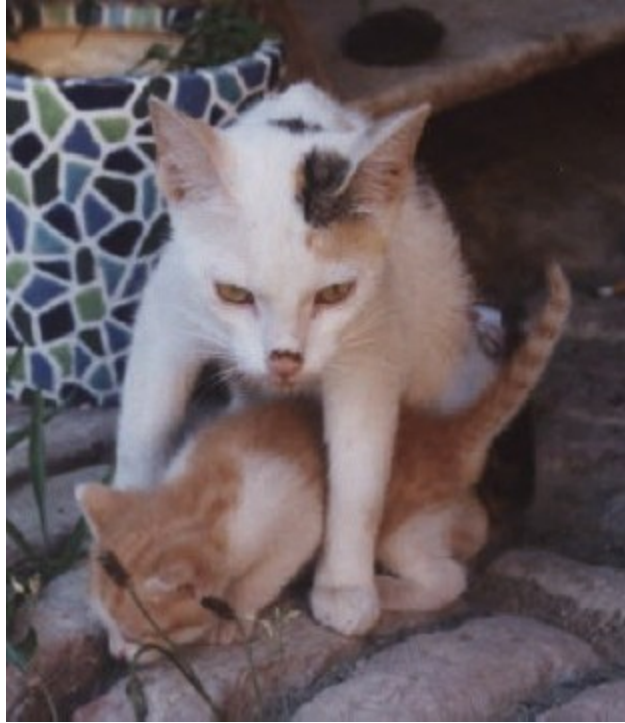
Butzi beschützt ...