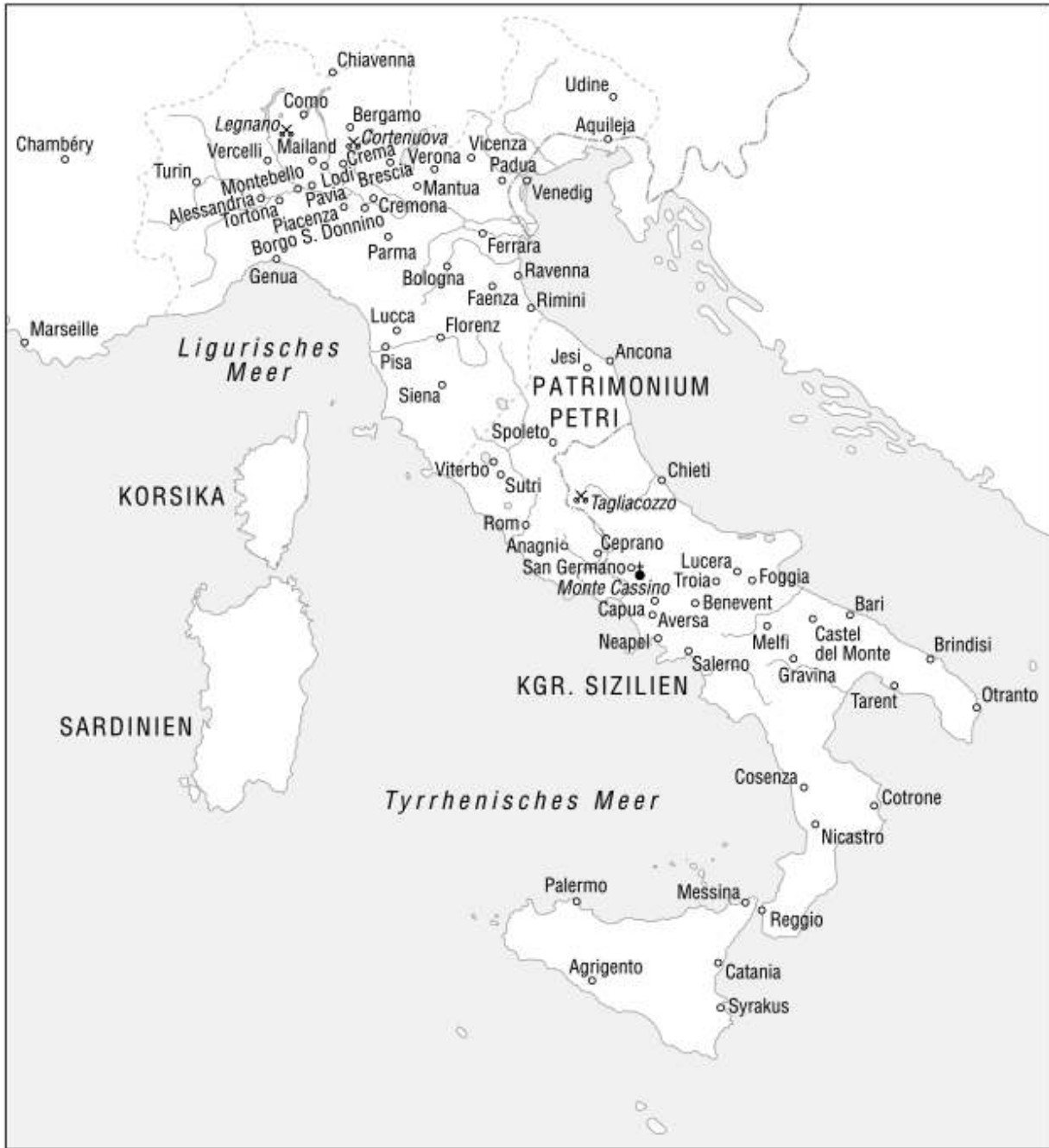
Italien in staufischer Zeit