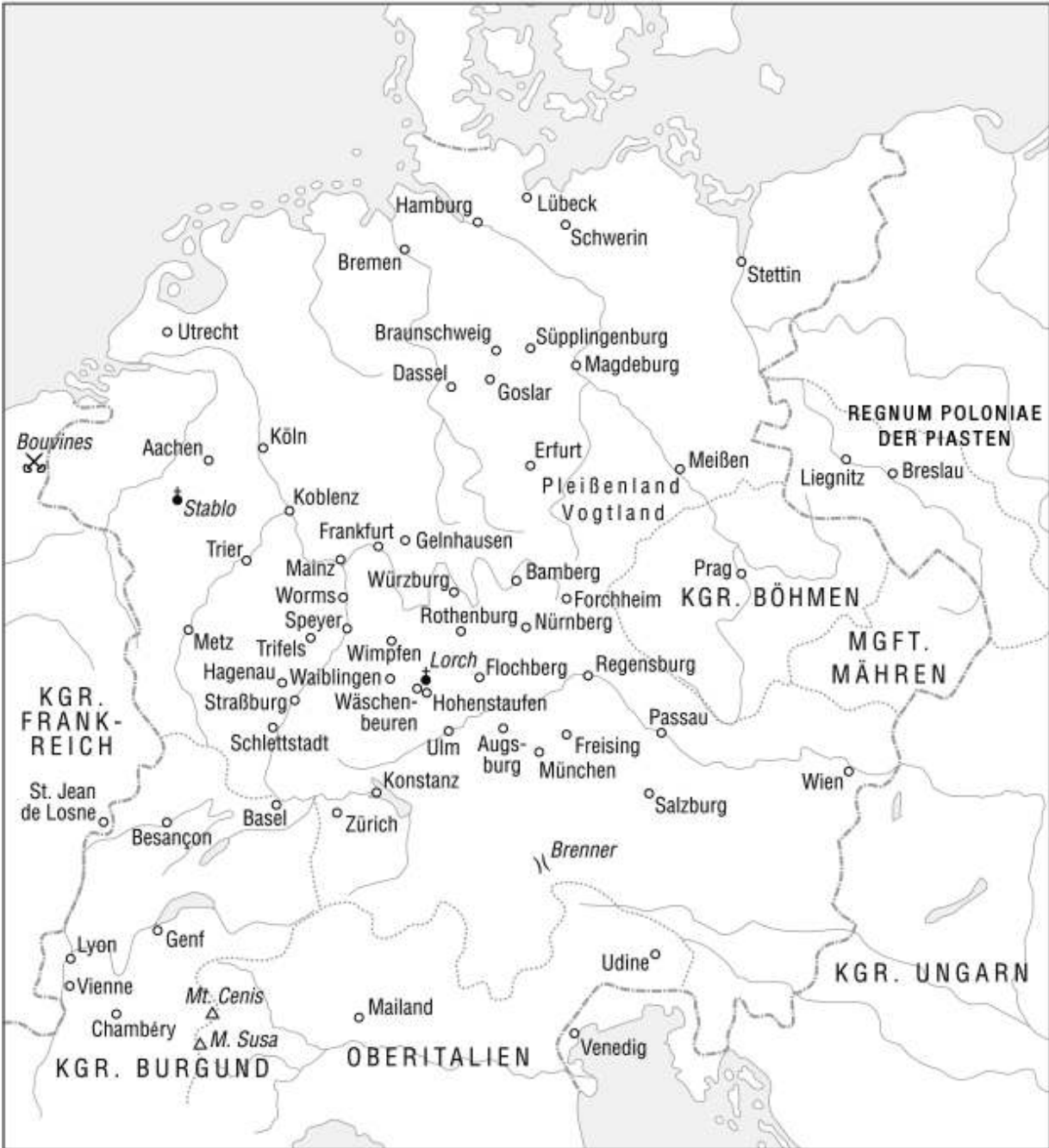
Deutschland in staufischer Zeit