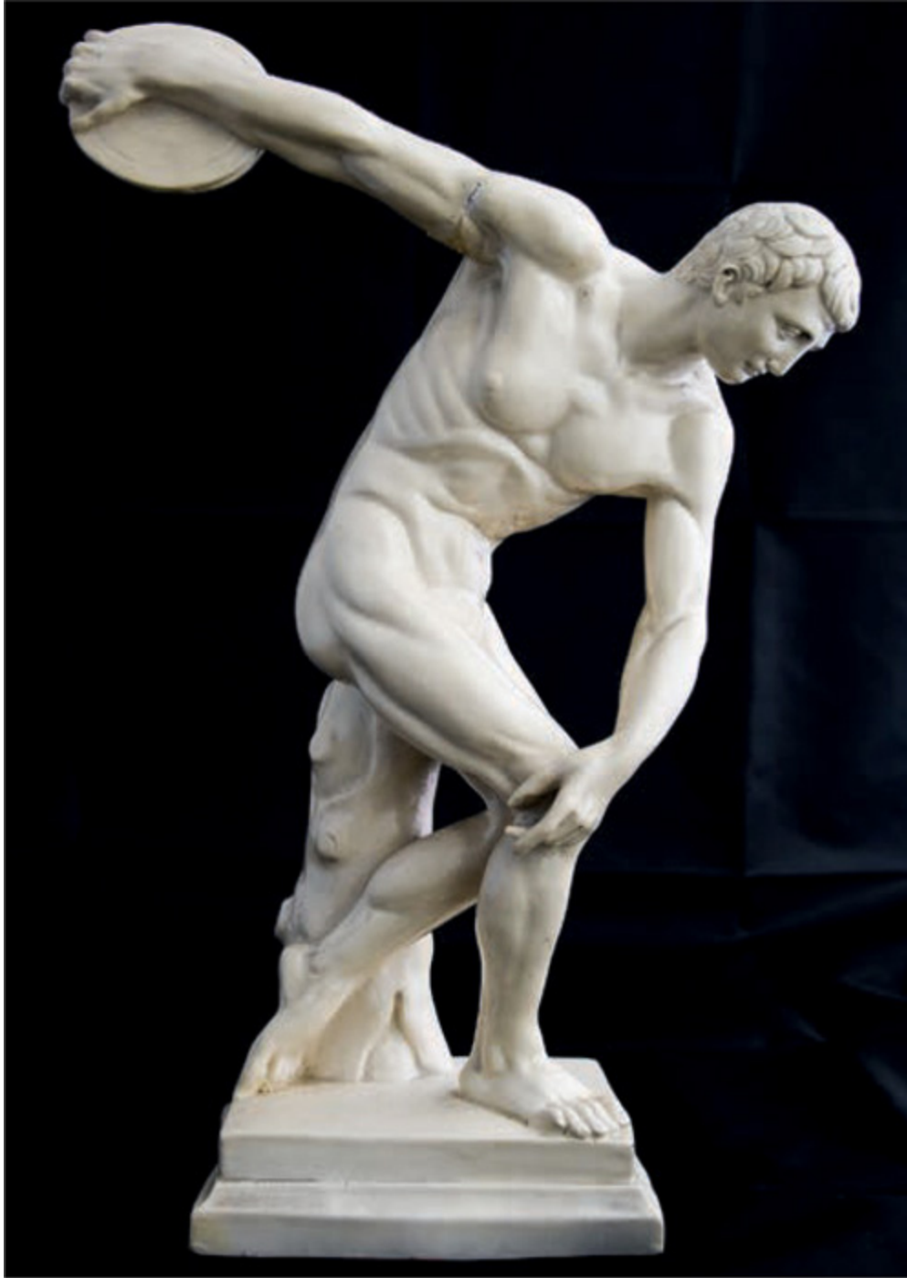
Die antike Skulptur »Diskobolos« gilt als Idealbild der Athletik.