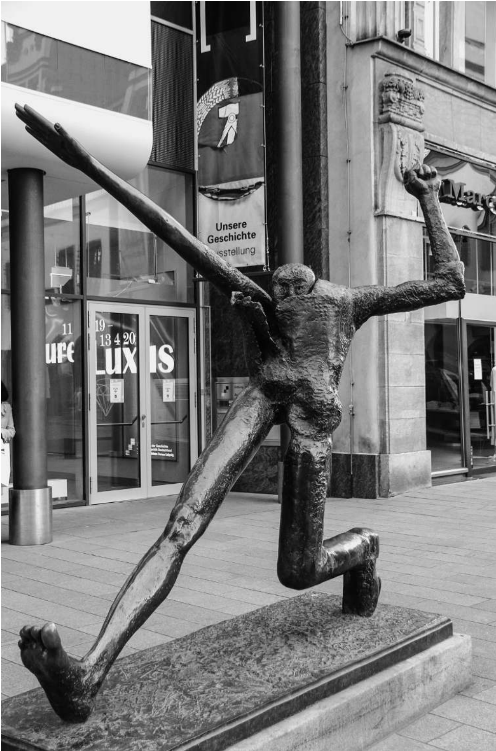
Der Jahrhundertsritt, Wolfgang Matheuer