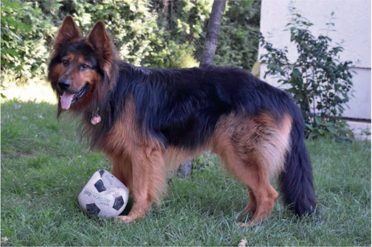
Abb. 1.2: Die im Download 14 bereitgestellten Bilder, wie hier vom altdeutschen Schäferhund Bary, eignen sich sehr gut für die biografieorientierte Arbeit. Die Abbildungen sind sowohl farbig sowie, früher eher üblich, auch in Schwarz-Weiß hinterlegt.