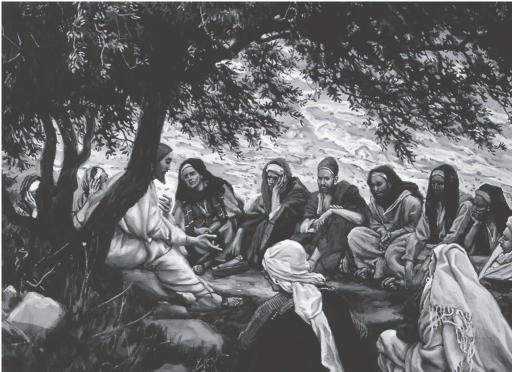
Yeshua, der Weisheitslehrer, unterrichtet seine Schüler