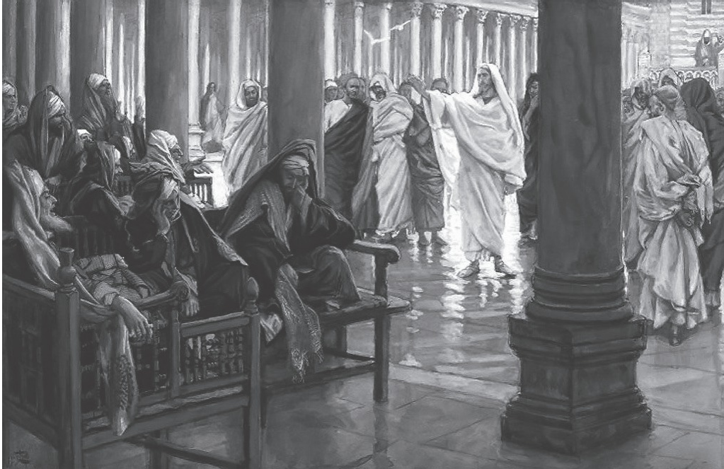
Yeshua bringt die Gelehrten gegen sich auf

Yeshua nimmt kein Blatt vor den Mund. Vertraut nicht euren Führern, sagt er, die euch weismachen wollen, das innere Licht sei anderswo als in eurem Herz-Geist. Vertraut vielmehr nur auf euch selbst. Blickt in eure eigene Tiefe. Dort könnt ihr die Stimme eures inneren Lehrers hören. Malkutha , das Königreich, wie Yeshua es in seiner Muttersprache, dem Aramäischen, nannte, ist nirgendwo und nirgendwann, nur im Hier und Jetzt, der einzigen Zeit, die existiert. Ewigkeit ist ein anderes Wort dafür. Also müssen wir nicht in den Himmel hinaufsteigen. Mose, von dem gerade die Rede war, wusste das natürlich, weshalb er auch sagte: „Nahe ist das Wort in deinem Mund und in deinem Herzen.“ (Dtn 30,14 Keine Neuigkeit also bringt Yeshua uns, sondern die Ewigkeit.