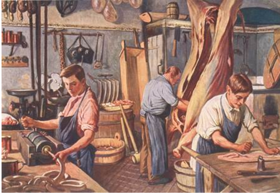
Fleischer auf einer alten Ansichtskarte