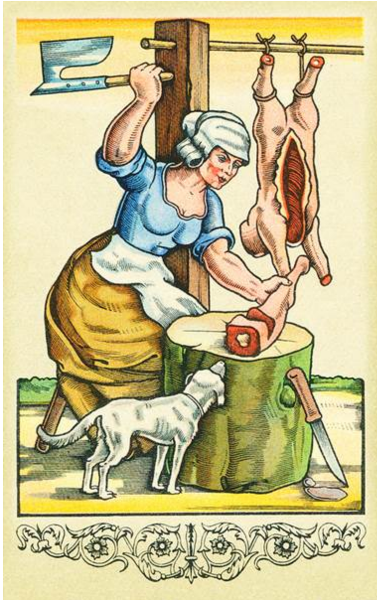
Fleischer um 1575