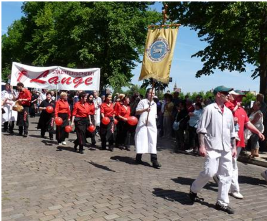
Fleischer der Schweriner Stadtfleischerei Lange beim Festumzug zur 850-Jahrfeier 2010, voran die Innungsfahne. Auf dem Transparent ist das moderne Innungszeichen der Fleischer zu sehen.