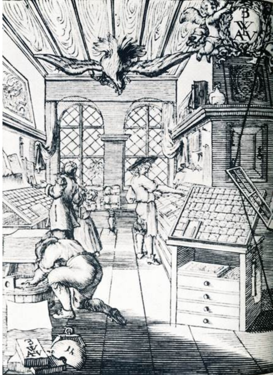
Buchdruckerwerkstätte im 17. Jahrhundert