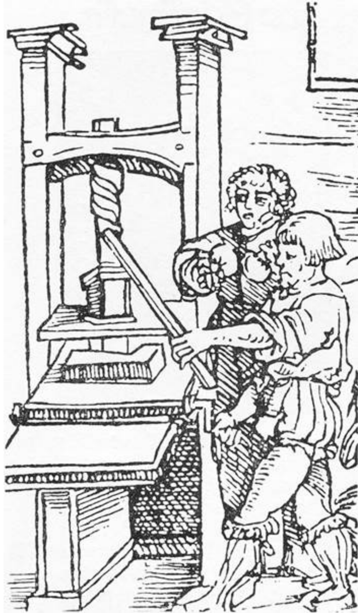
Druckpresse um 1520