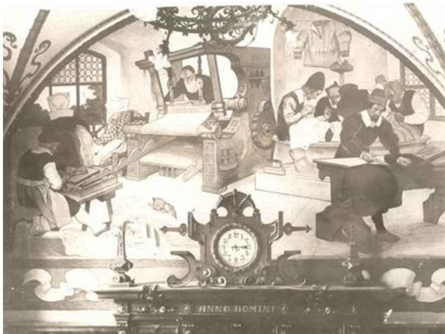
Druckerei im 19. Jahrhundert

Um 1450 führte der Mainzer Goldschmied Johannes Gutenberg ein komplettes maschinenbetriebenes Drucksystem mit beweglichen metallenen Lettern ein. Der