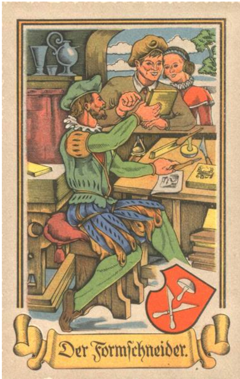
Formschneider um 1575, Quelle: Tengelman 1