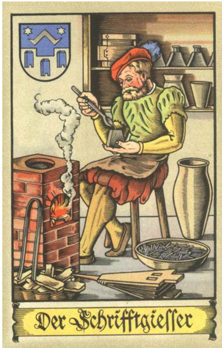
Schriftgießer um 1575, Quelle: Tengemann 3