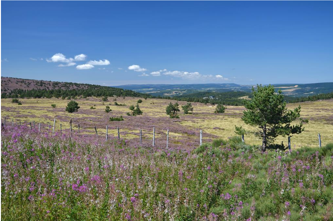
Einsamkeit pur: Cévennes