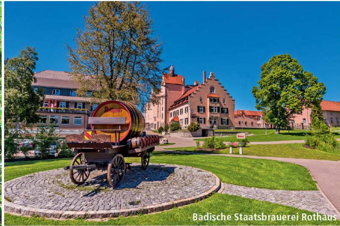
Badische Staatsbrauerei Rothaus