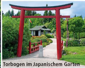
Torbogen im Japanischem Garten