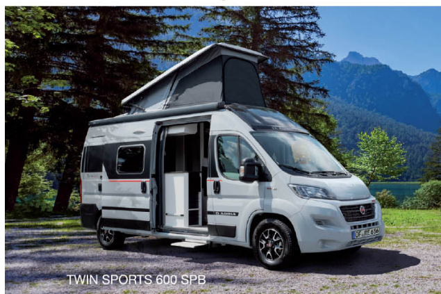
TWIN SPORTS 600 SPB