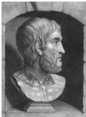
Pythagoras von Samos.

Hand, der vorschlagen kann: „Legen wir die Zahlen auf den Tisch“. Scheinbar ist allein mit ihnen eine objektive Sicht der Wirklichkeit möglich. Wenn wir meinen, dass sich etwas „auszahle“ – auch Immaterielles, wie eine Reise zu den Kulturdenkmälern Italiens, der Skiausflug nach St. Moritz oder der Besuch eines philharmonischen Konzerts in Wien, führen wir es doch auf einen quantitativen Vergleich mit unserem Einsatz zurück, den wir auf Heller und Pfennig genau anzugeben trachten.