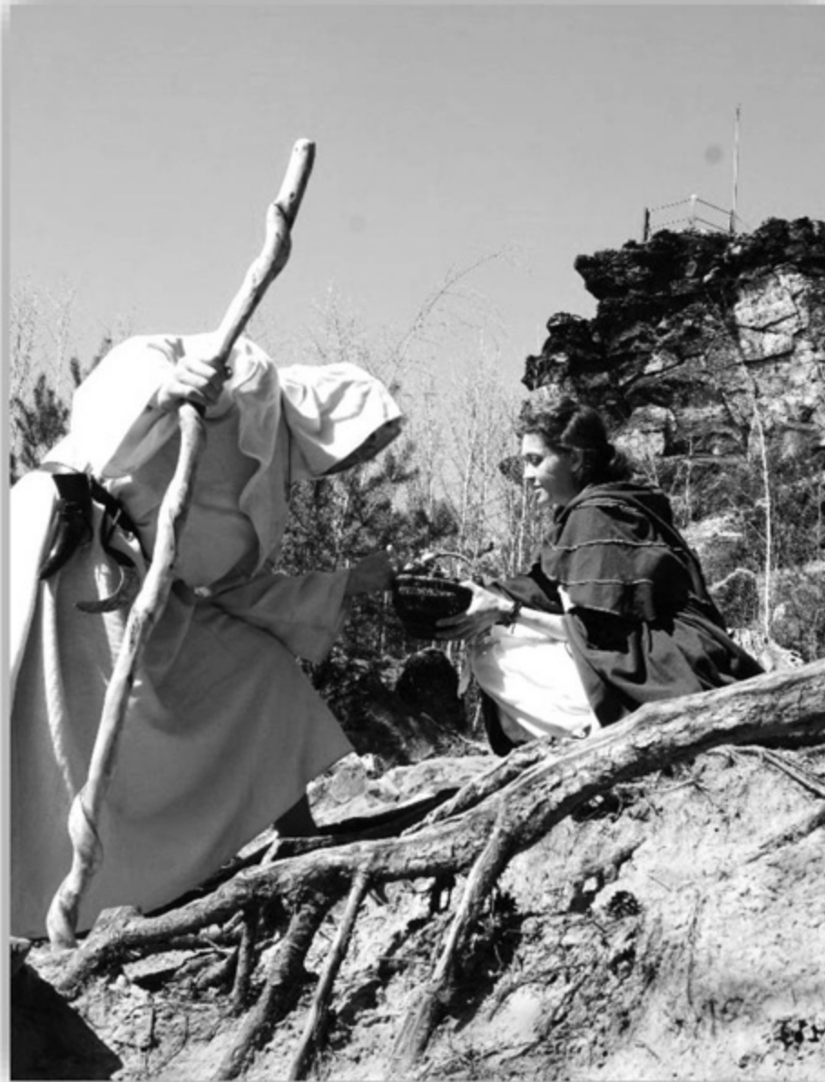
Aus unserem Großvater-Foto-Shooting „Trude & Druide“ von Sagenhafter Harz