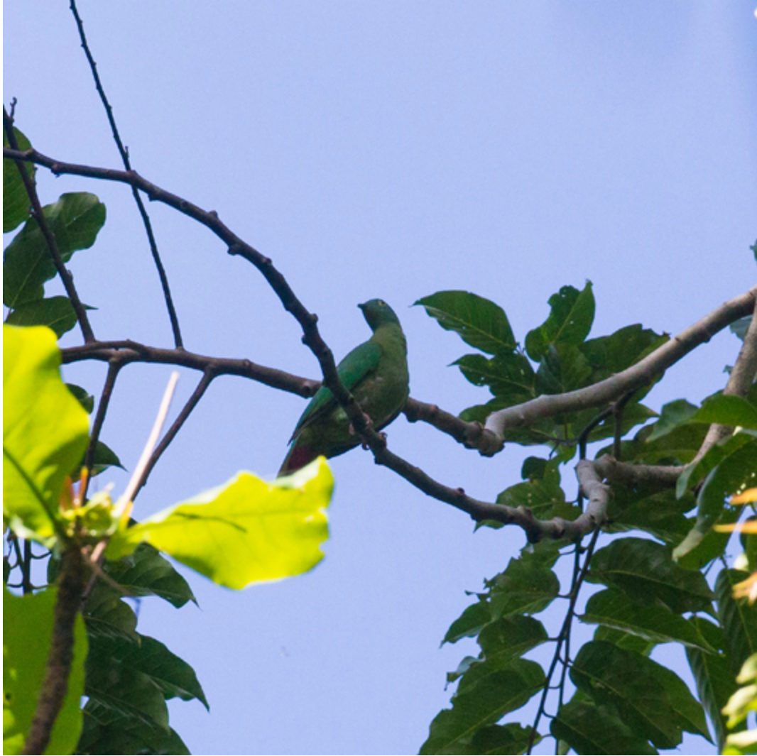
Blaukappen-Fruchttaube ( Ptilinopus monacha )