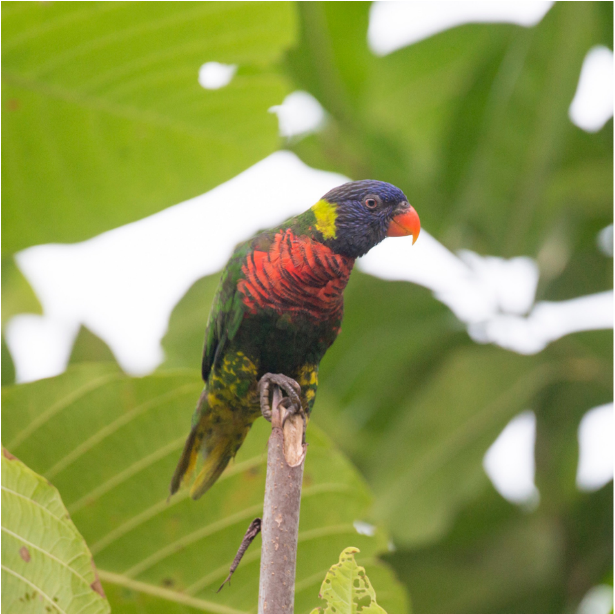
Allfarblori ( Trichoglossus haematodus )