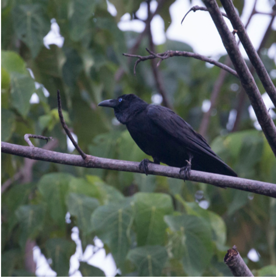
Bernsteins Braunkopfkrähe ( Corvus fuscicapillus megarhynchus )