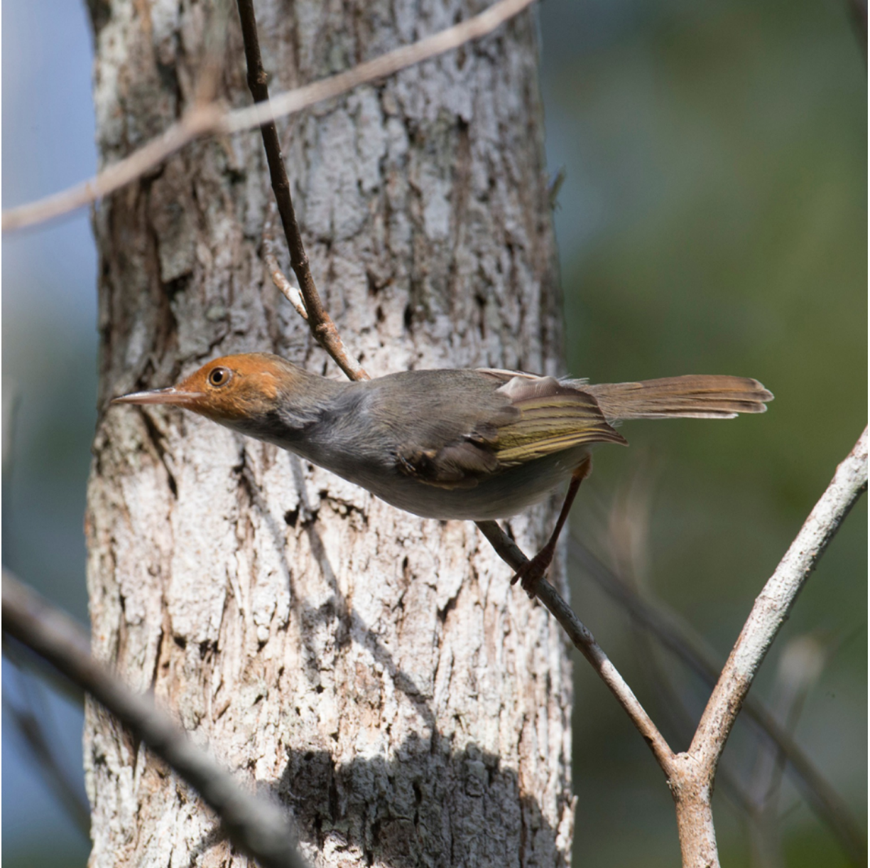
Borneo-Grauschneidervogel ( Orthotomus ruficeps borneoensis )