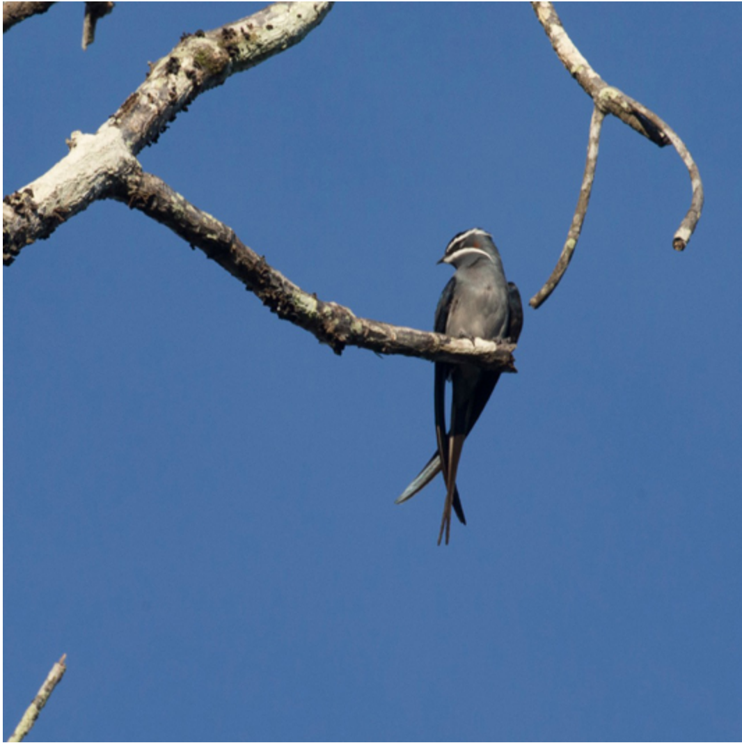
Bartbaumsegler ( Hemiprocne mystacea )