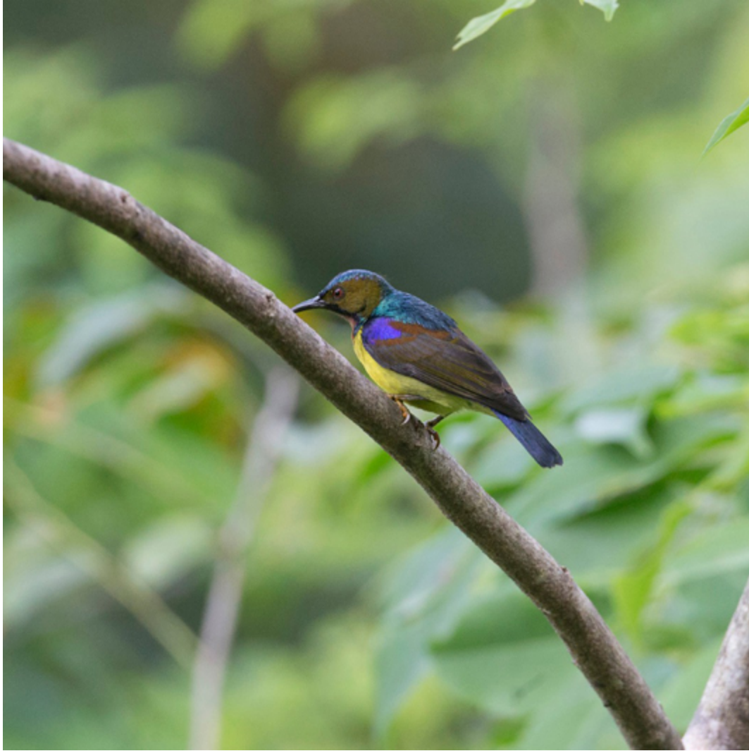
Borneo-Braunkehlnektarvogel ( Anthreptes malacensis bornensis )