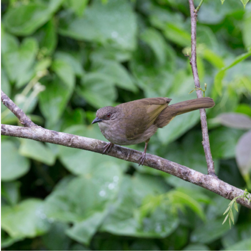
Borneo-Malaienbühl ( Pycnonotus plumosus hutzi )