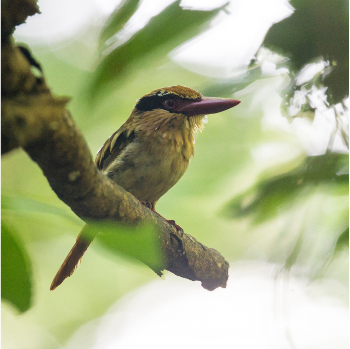
Blauhriest ( Cittura cyanotis )