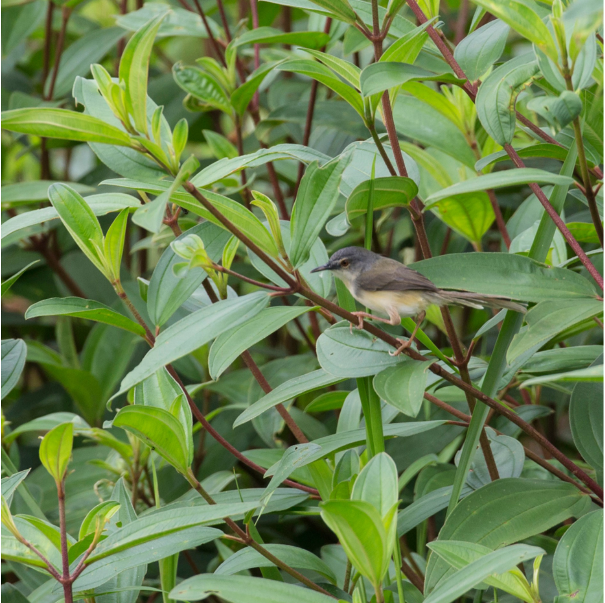
Borneo-Gelbbauchprinie ( Prinia flaviventris latrunculus )