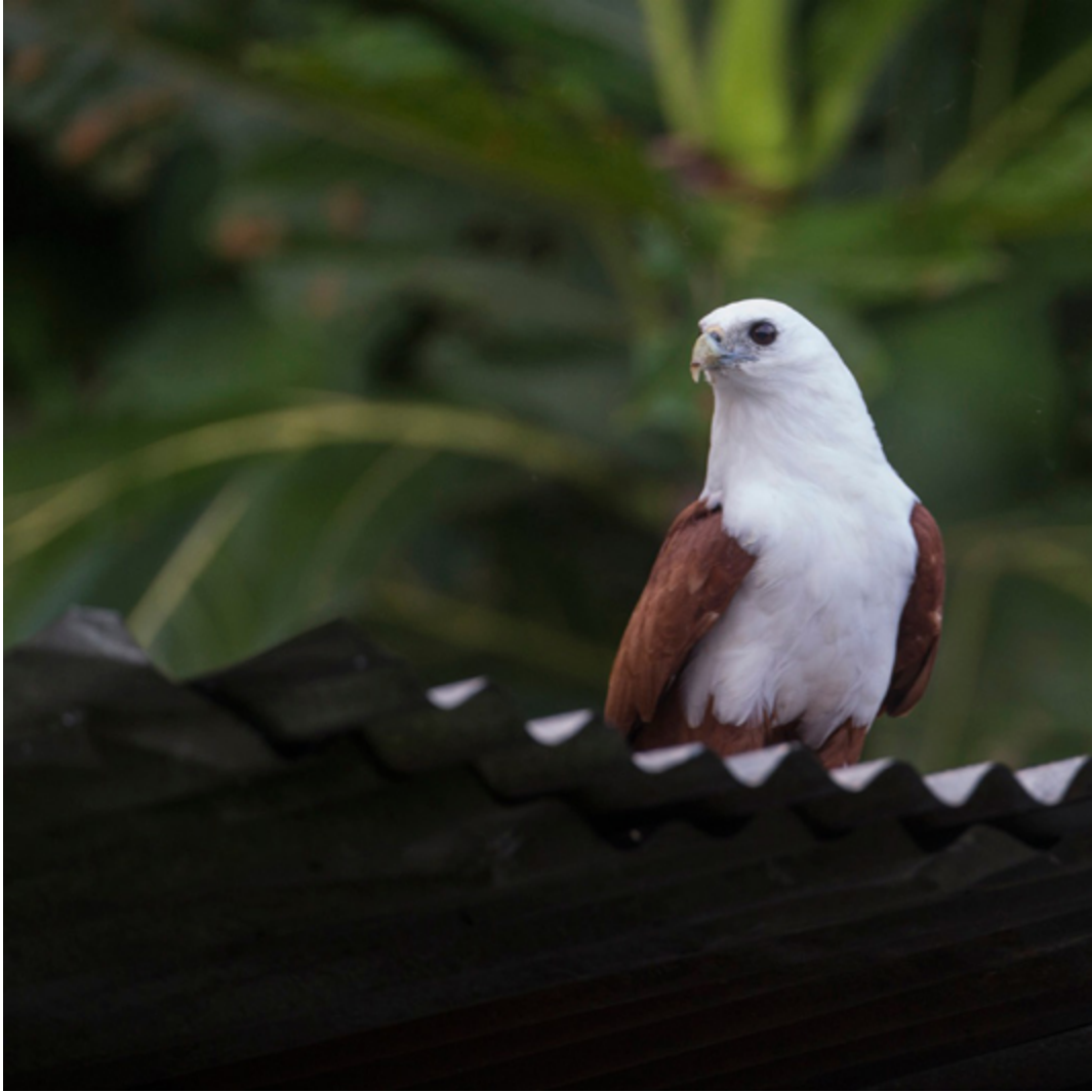
Australische Brahimenweih ( Haliastur indus girrenera )