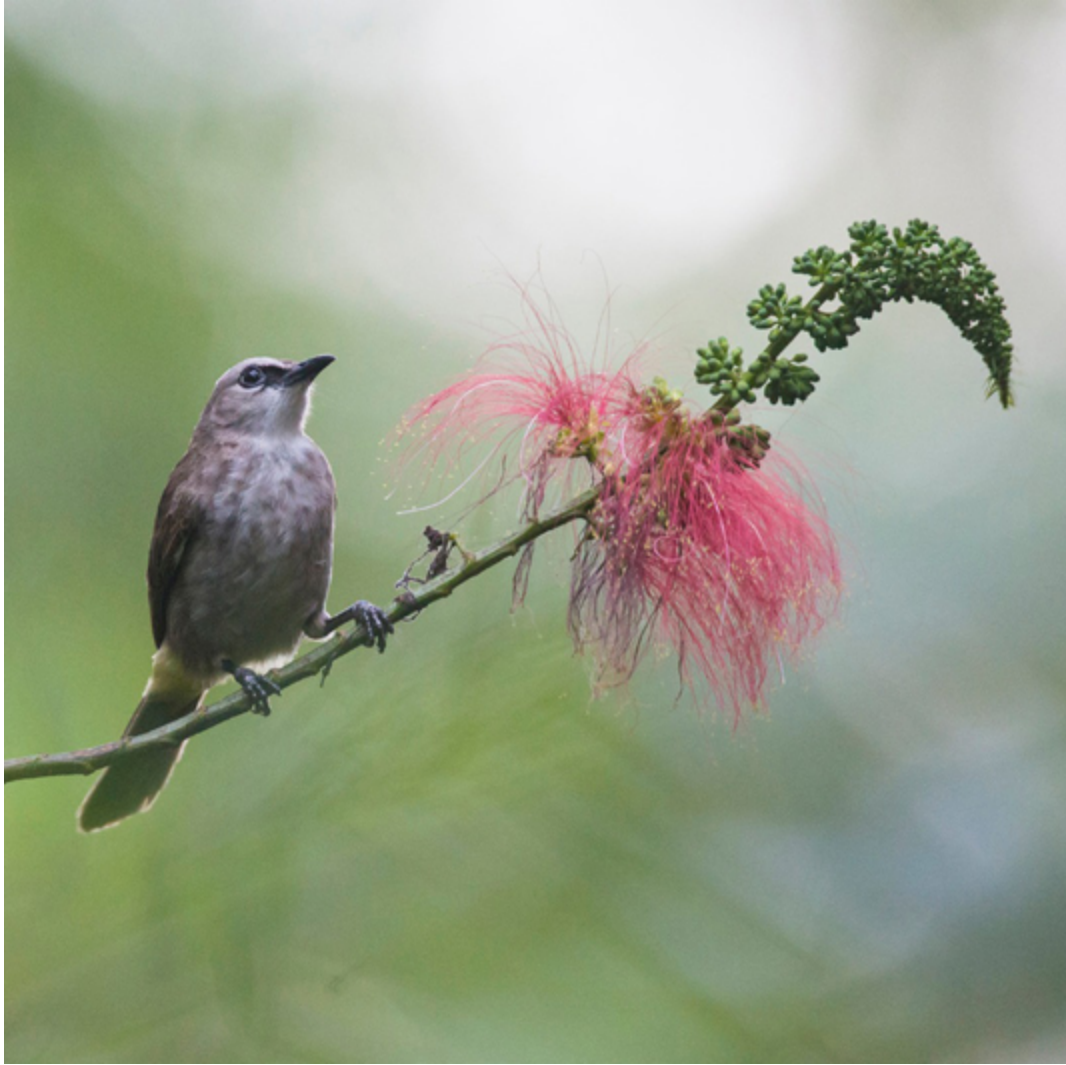
Borneo-Augenstreifbülbul ( Pycnonotus goiavier yourdini )