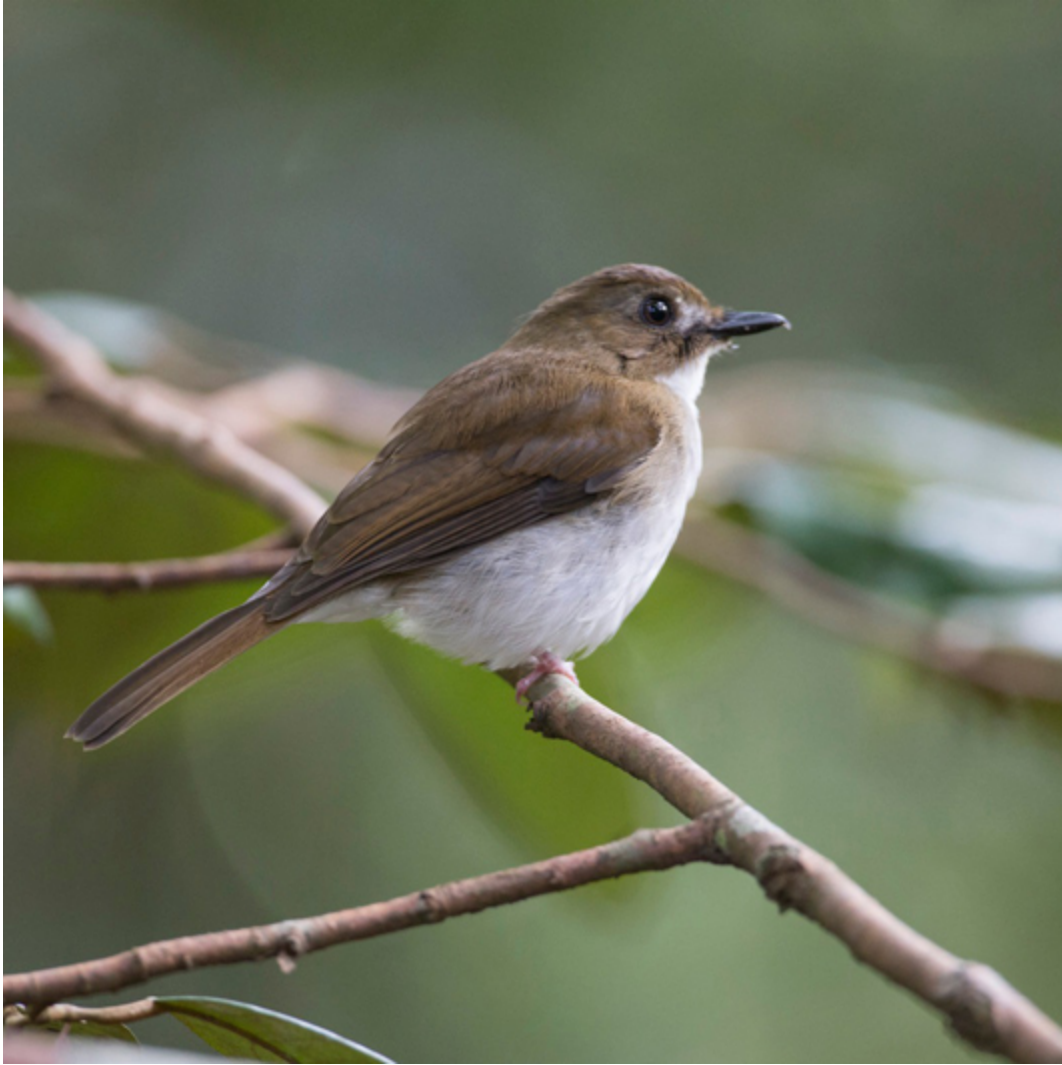
Borneo-Bartstreifzweigimalie ( Malacopteron magnirostre cinereocapilla )