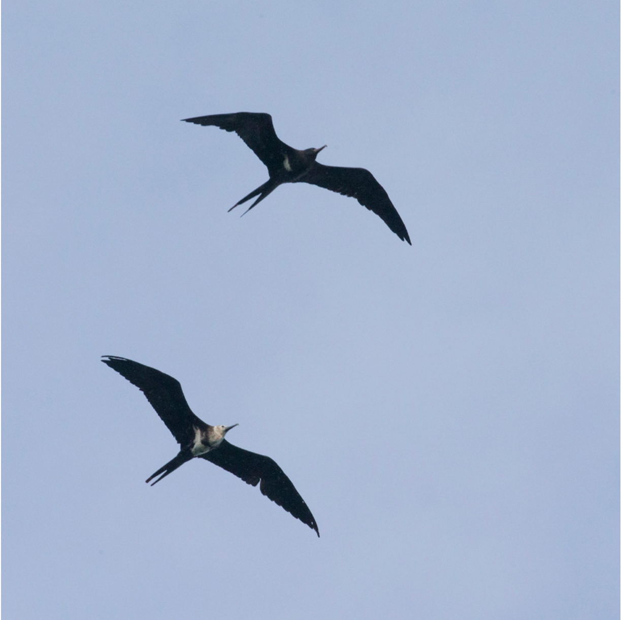
Arielfregattvogel ( Fregata ariel )