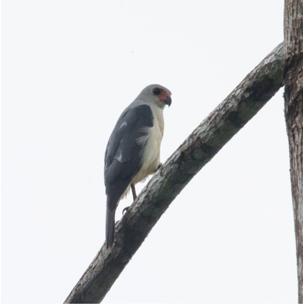
Aschkopfhabicht ( Accipiter poliocephalus )