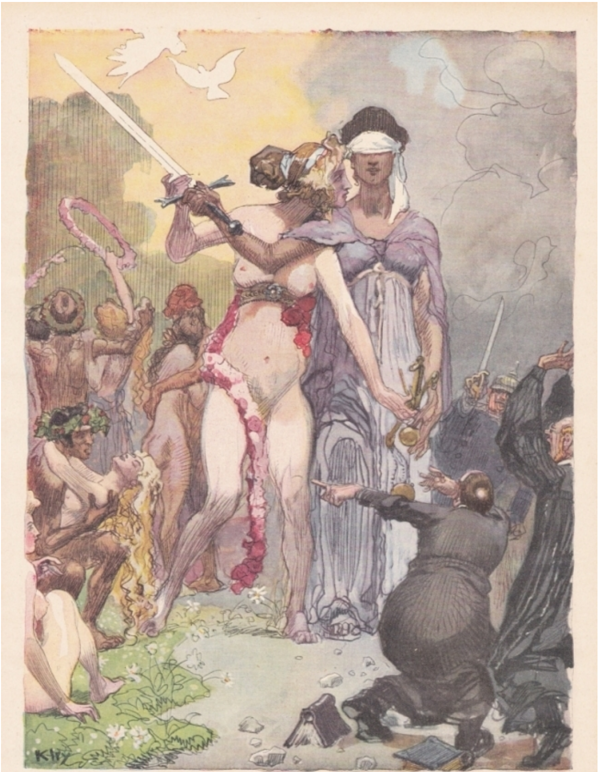
Das Recht auf Erotik