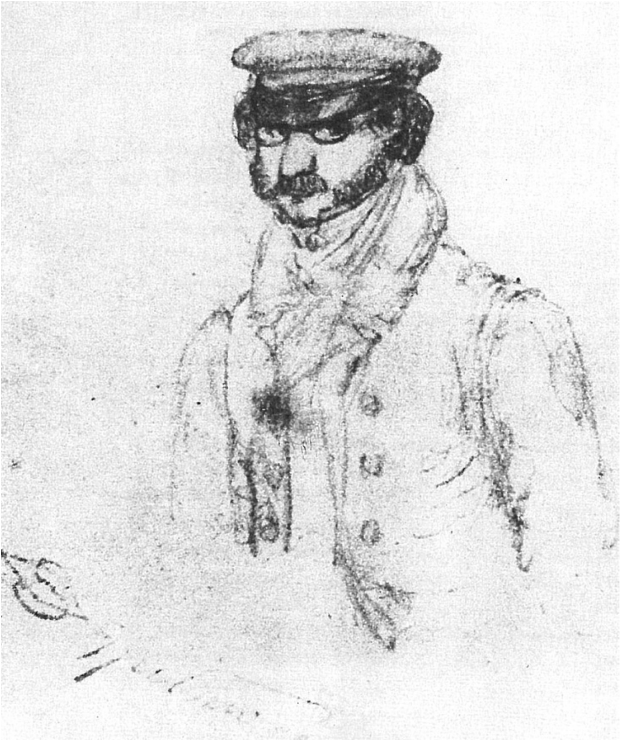
Selbstporträt des Carl Spitzweg um 1832 Abb.: Wikipedia01

Unmittelbar nach seinem bestandenen Staatsexamen 1832 nahm er sich eine Auszeit und reiste erneut nach Triest, um