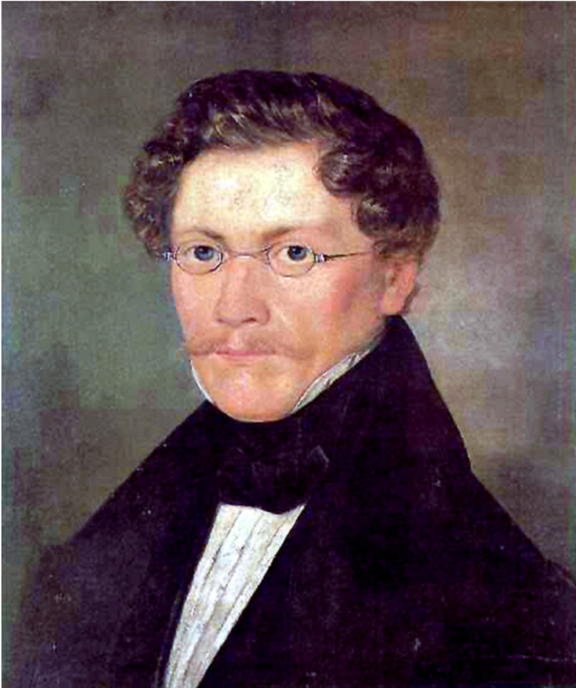
Selbstporträt des Carl Spitzweg um 1842. Standort Museum Georg Schäfer in Schweinfurt.

Es folgte eine Zeit, in der Spitzweg zahlreiche Bilder verkaufte und zudem besonders in München zu einiger Reputation gelangte. So ergab es sich auch, dass Kaspar