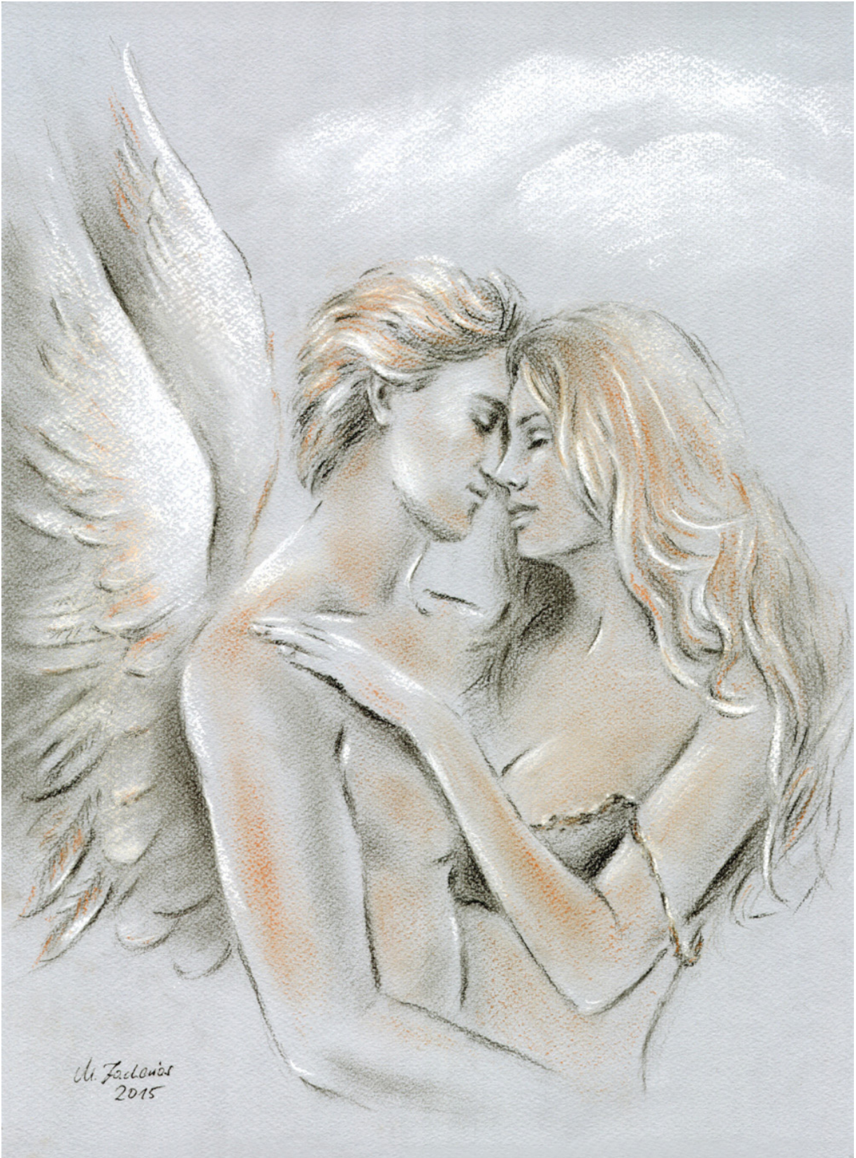
Engel auf Erden, Pastellzeichnung