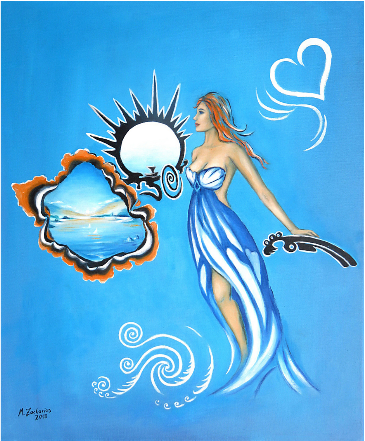
Erwachen, Öl auf Leinen