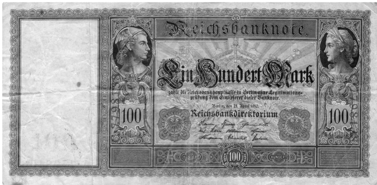
Abb. 1: Banknote zu 100 Mark

bereitstellen. Dann gibt es zwar immer mehr Waren, die Geldmenge bleibt jedoch konstant. Die Folge: Der Preis der Waren sinkt, es kommt zu einer Deflation. Das wiederum führt dazu, dass sich Firmen und Privatpersonen beim Einkauf zurückhalten. Schließlich könnte die Ware ja in Kürze noch günstiger zu haben sein. Die Nachfrage geht zurück, als Folge davon bricht die Produktion ein, und die Wirtschaft gerät in einen Abwärtsstrudel. Genau das passierte im 19. Jahrhundert in verschiedenen Ländern immer wieder.