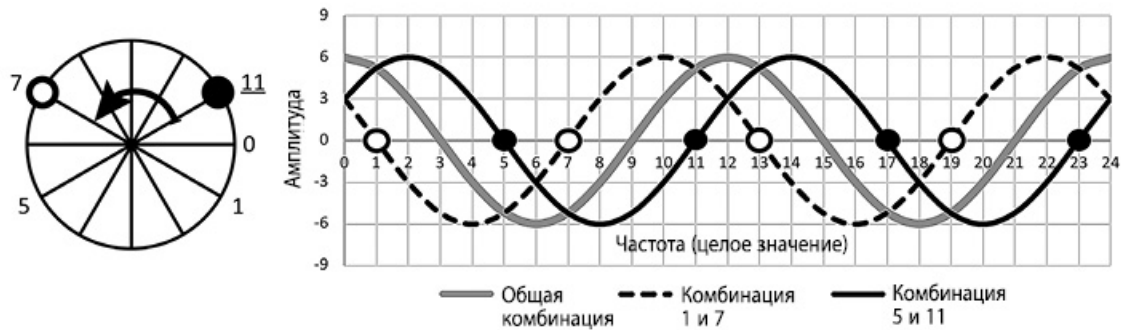
Двенадцатеричный график простых чисел

Тем не менее нумерология идет еще дальше, придавая определенные качества или индивидуальность каждой числовой частоте цикла и двузначным мастер-числам, таким как 11, 22 и 33. Эти определения выдержали испытание временем, оставаясь неизменными на протяжении тысячи лет. Итак, я задался вопросом, как традиционные значения чисел десятичной системы могут вписаться в новую открытую мной двенадцатеричную схему, если это вообще возможно.