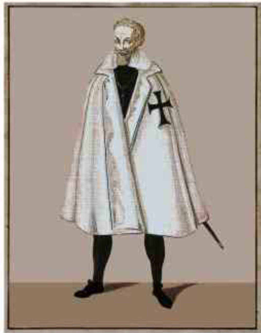
Abb. 1: Deutschordensritter um 1600 (weißer Mantel mit großem schwarzem Kreuz)

auch die namentliche Bezeichnung des Temmelscher Hofgutes zu erklären.