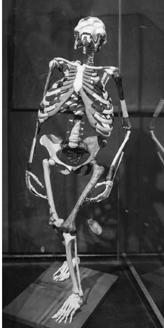
Abb. 1: Lucy, Äthiopisches Nationalmuseum, Addis Abeba.

um Höhlenmalereien, sondern die Darstellungen finden sich teilweise auch unter freiem Himmel, unter Felsvorsprüngen, wo sie über die Jahrtausende geschützt waren und auch die damaligen Künstler und ihre Herden möglicherweise Schutz vor Sonne und Regen fanden. Diese frühen Kunstformen finden sich in allen Ländern am Horn von Afrika – in den heutigen Staaten Äthiopien (bis in den tiefen Süden), Eritrea, Dschibuti und Somalia, wo sich im Felsmassiv von Laas Geel bei