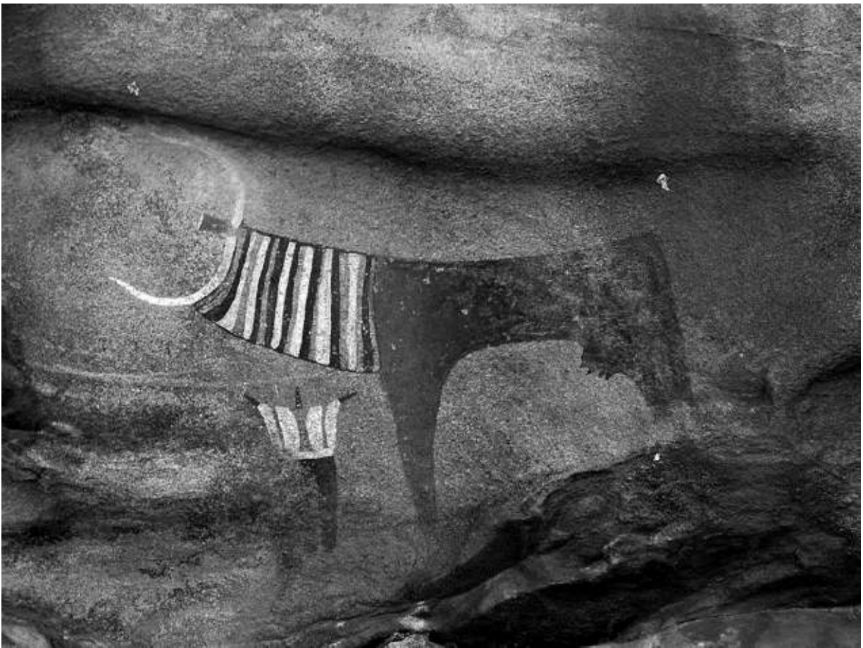
Abb. 2: Prähistorische Felsmalerei in Laas Geel, Somalia.

Hargeysa die vielleicht besterhaltenen polychromen Felsmalereien Afrikas befinden. Teilweise sind sie fast 10 000 Jahre alt, damit aber deutlich jünger als die Malereien in den europäischen Höhlen wie z. B. in Lascaux und Altamira. Abgebildet werden vor allem Rinder und Schafe, aber auch Giraffen, Elefanten, Strausse und Kamele. Menschen werden ebenso dargestellt, bewaffnete Jäger und Krieger, auch eine Melk-Szene. Vergleichbare Höhlenmalereien befinden sich im somalischen Dhambalin und in Karin Heegan (70 km östlich von Boosaaso).