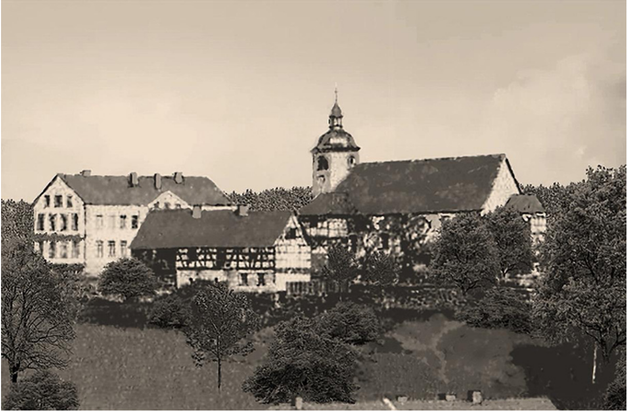
Die über 400 Jahre alte Kirche „Peter und Paul“ wurde leider schon im Jahre 1892 abgerissen (Abbildung nach einer Originalfotografie des in Bad Elster tätigen Fotografen Emil Tietze ca. 1880)