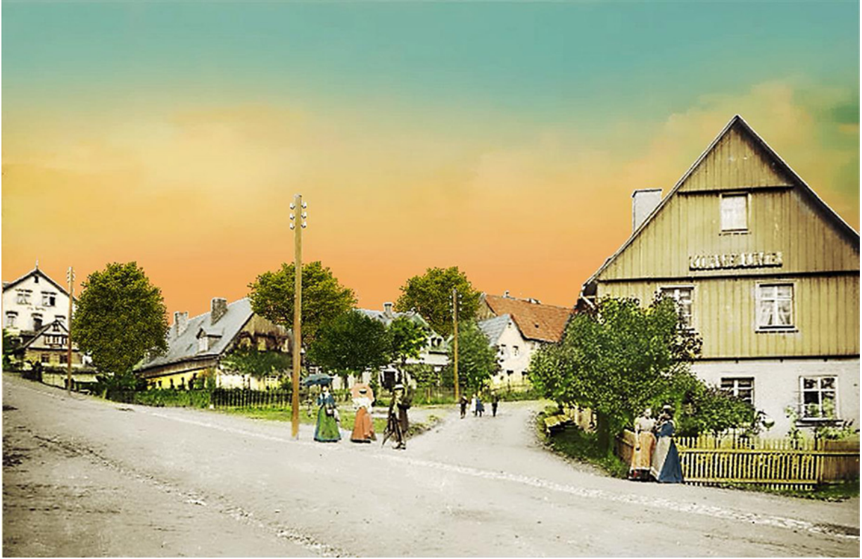
Partie im Dorf - rechts das Gästehaus „Kornblume“