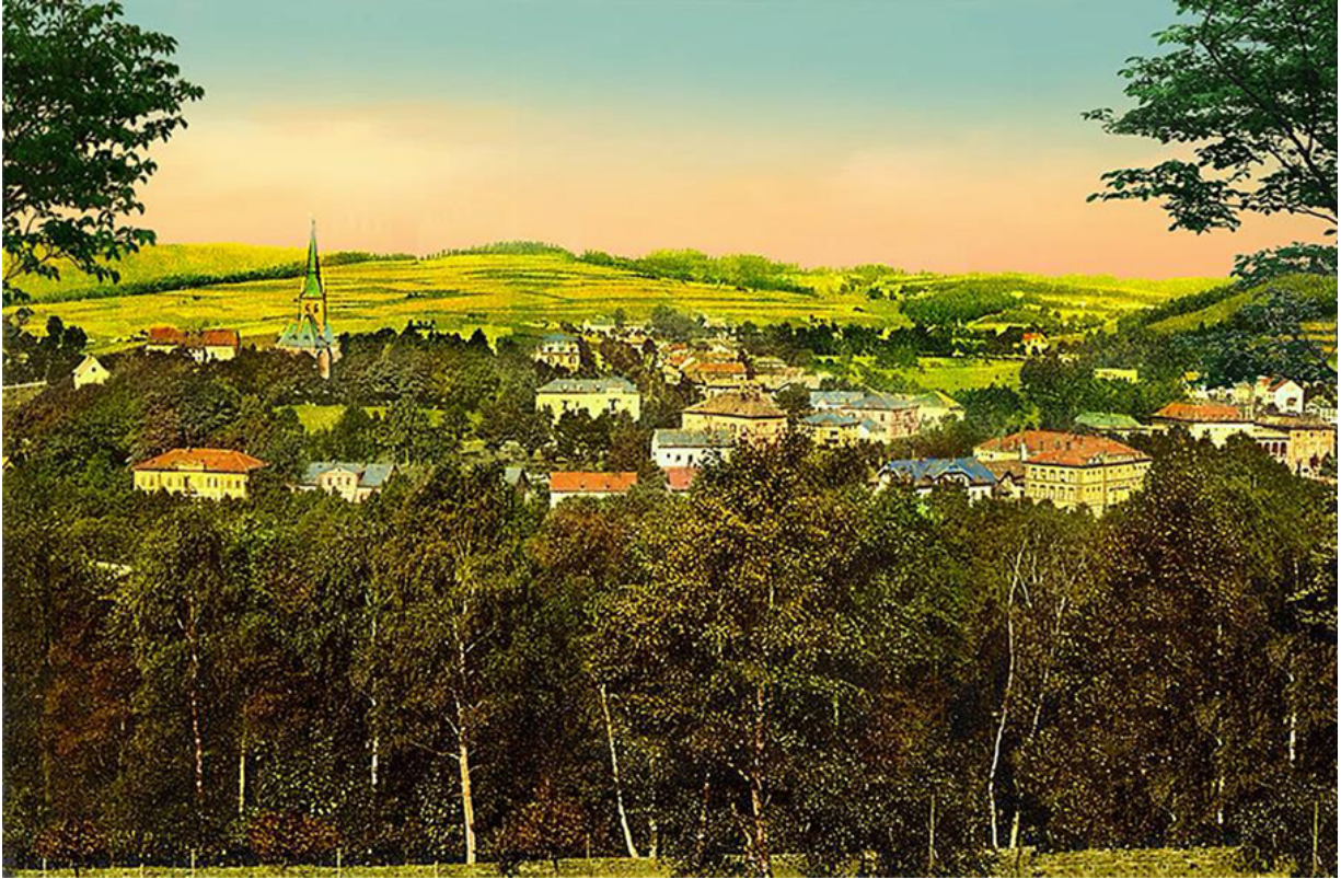
Ortspanorama von Bad Elster mit der 1892 neu erbauten St. Trinitatiskirche