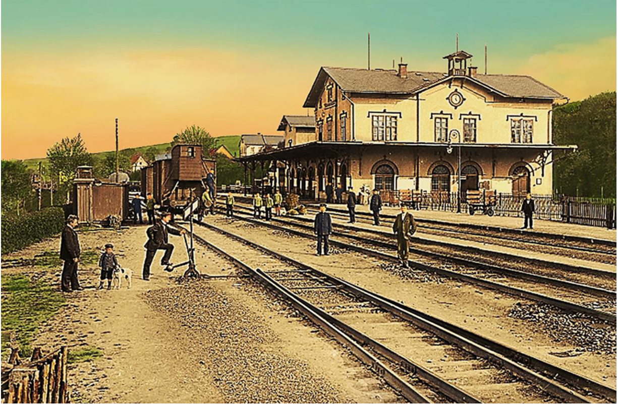
Bahnhof Bad Elster