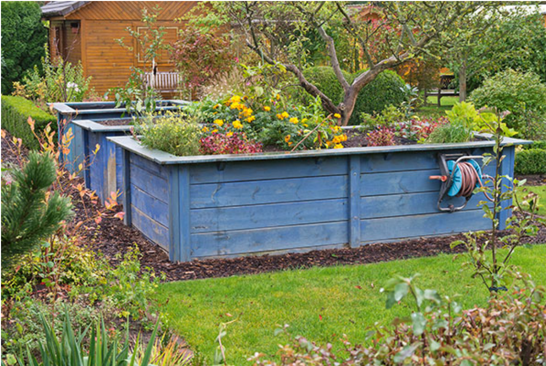
Kurze Wege vom Wasseranschluss bis zum Hochbeet erleichtern das Gießen.

vielen Pflanzen zugutekommt. Sie liefern höhere Erträge und bilden intensivere Aromen aus. Das gilt z. B. für Tomaten und Paprika, aber auch für alle mediterranen Kräuter wie Rosmarin, Lavendel und Thymian. Standorte mit weniger Licht sind für den Anbau der meisten Gemüse-, Kräuter- und Obstarten ungeeignet. Solche Plätze kann man nur mit schattenverträglichen Arten bepflanzen, die eher zu den Zierpflanzen gehören.