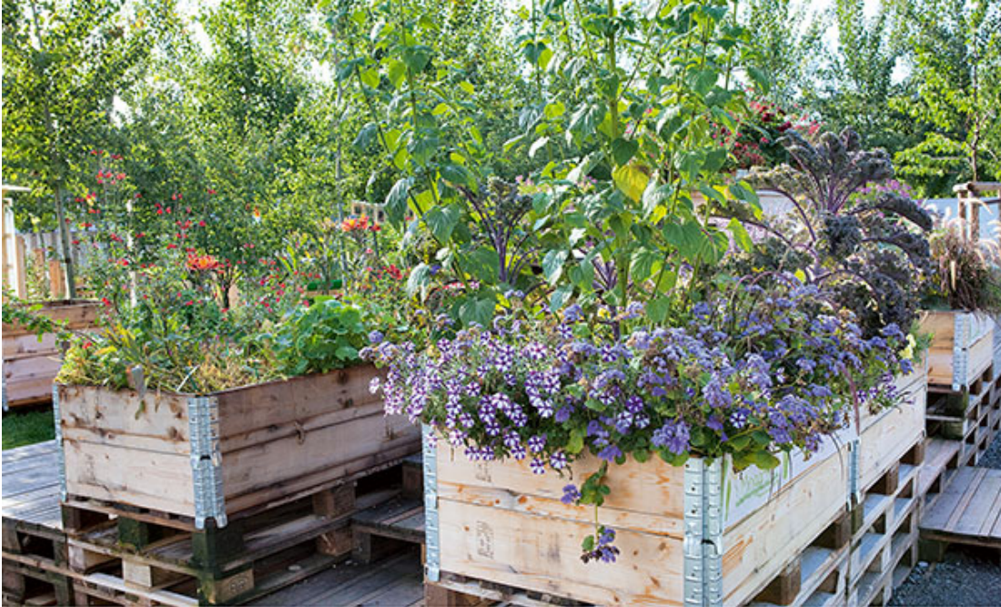
Mit einem Unterbau, z.B. einer Europalette, kann ein Hochbeet auch auf befestigtem Grund stehen.