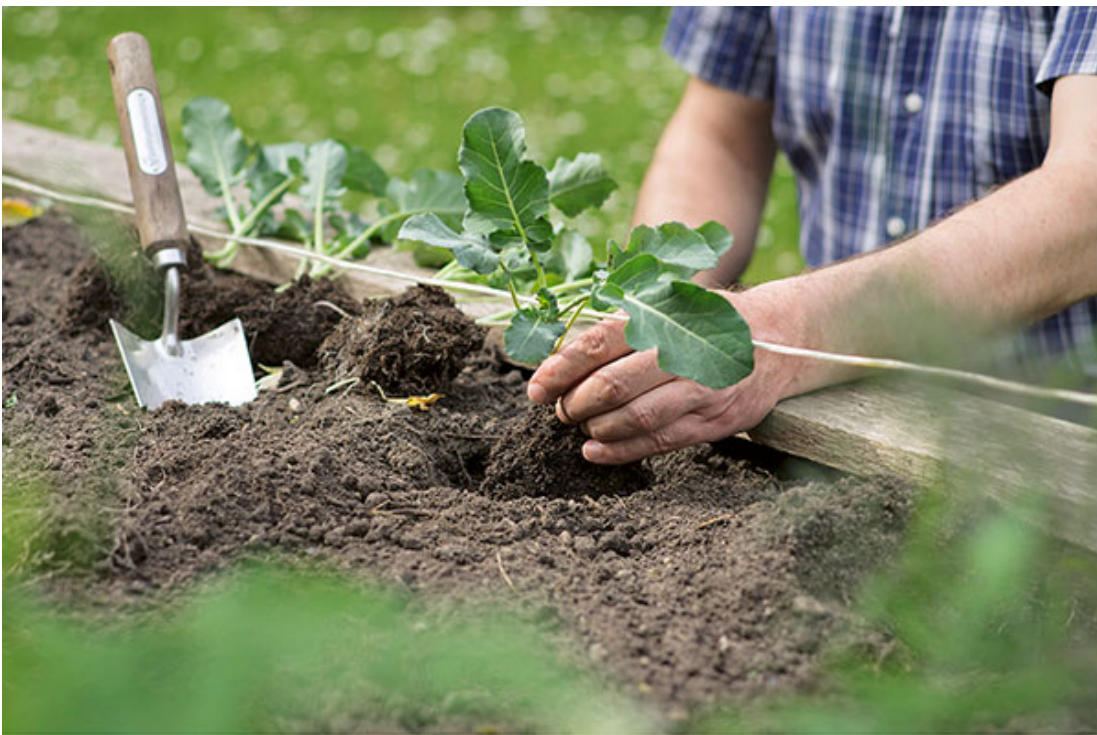
Im Frühjahr wird das Beet komplett neu bepflanzt. Füllen Sie es vorher mit Erde auf.

Die Frage nach dem Arbeitsaufwand für ein Hochbeet lässt sich nicht pauschal beantworten. Dieser hängt zum einen von der Größe des Hochbeets ab, zum anderen vom Pflegebedarf der Bepflanzung. Zudem spielt der Standort des Beets eine Rolle und ob Sie bereit sind und die Möglichkeit haben, die Bewässerung zu automatisieren.