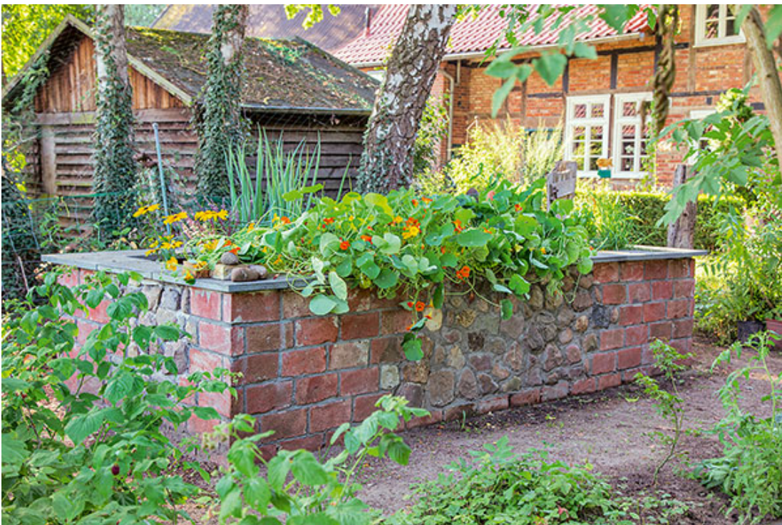
Das Hochbeet aus Ziegel- und Feldsteinen passt perfekt zum restaurierten Fachwerkhaus.

Im Hochbeet haben Sie die Möglichkeit, viele verschiedene Gemüse- und Kräuterarten anzubauen. Ein Hochbeet ist also ideal, wenn Sie an einer gesunden, abwechslungsreichen Ernährung interessiert sind und sich mit unterschiedlichen Arten möglichst das ganze Jahr über selbst versorgen möchten. Ohne viel Zutun entsteht daher im Hochbeet eine gesunde Mischkultur. Mit ein wenig Fachwissen setzen Sie Pflanzen, die sich gegenseitig positiv beeinflussen, nebeneinander. In einem solchen förderlichen Miteinander werden die Nährstoffvorräte aus dem Boden von den Pflanzen optimal ausgenutzt. Außerdem bleiben Obst, Kräuter und Gemüse ohne den Einsatz chemischer Pflanzenschutzmittel gesund.