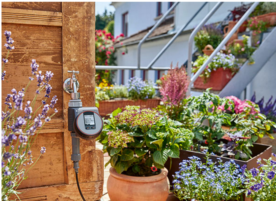
Ein Bewässerungscomputer übernimmt auch im Urlaub die Wasserversorgung.

Vorfeld, welche Kulturen folgen sollen, und besorgen frühzeitig das entsprechende Saatgut, dann ist die Arbeit schnell erledigt.