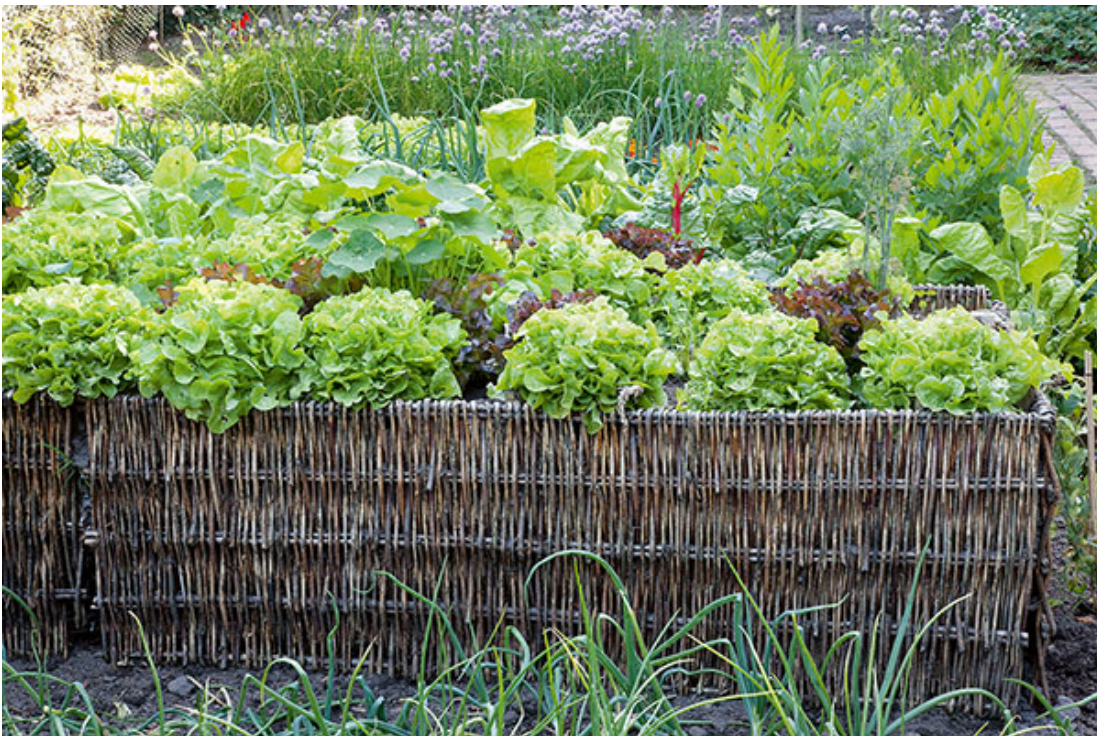
In diesem dicht bepflanzten Hochbeet aus Flechtwerk ist Platz für eine Vielfalt an Salaten.