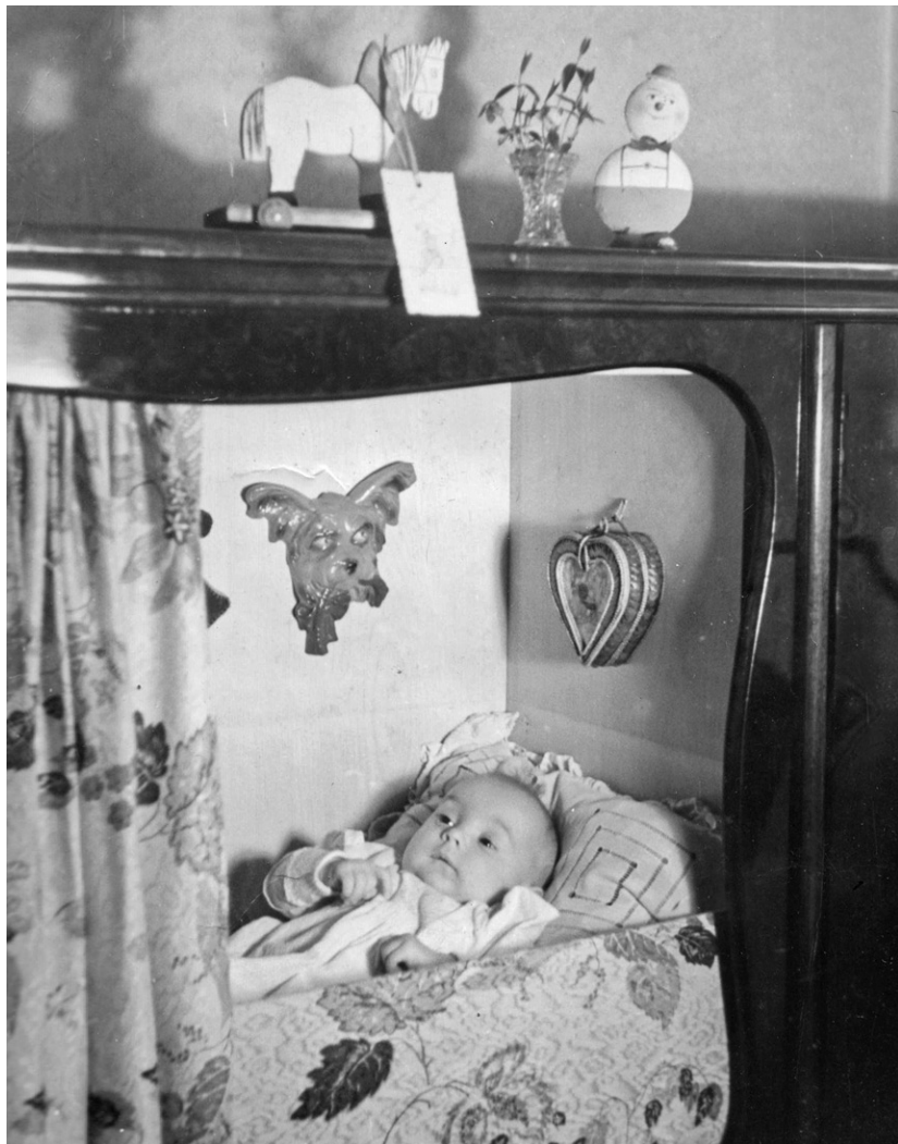
Uta im Bücherregal