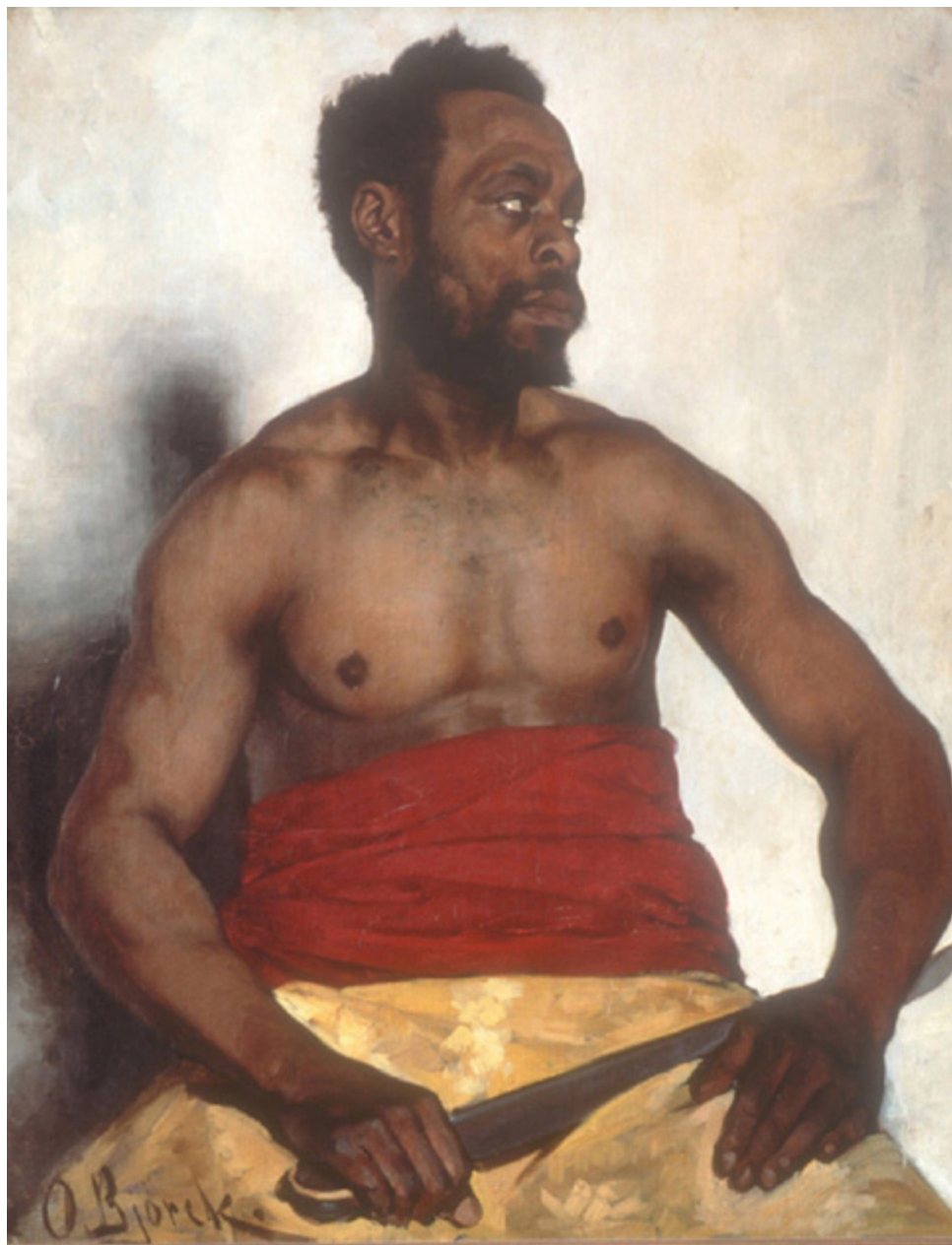
Oscar Björcks målning som visades på Nationalmuseums utställning «Främlingen - dröm eller hot?» 1996.