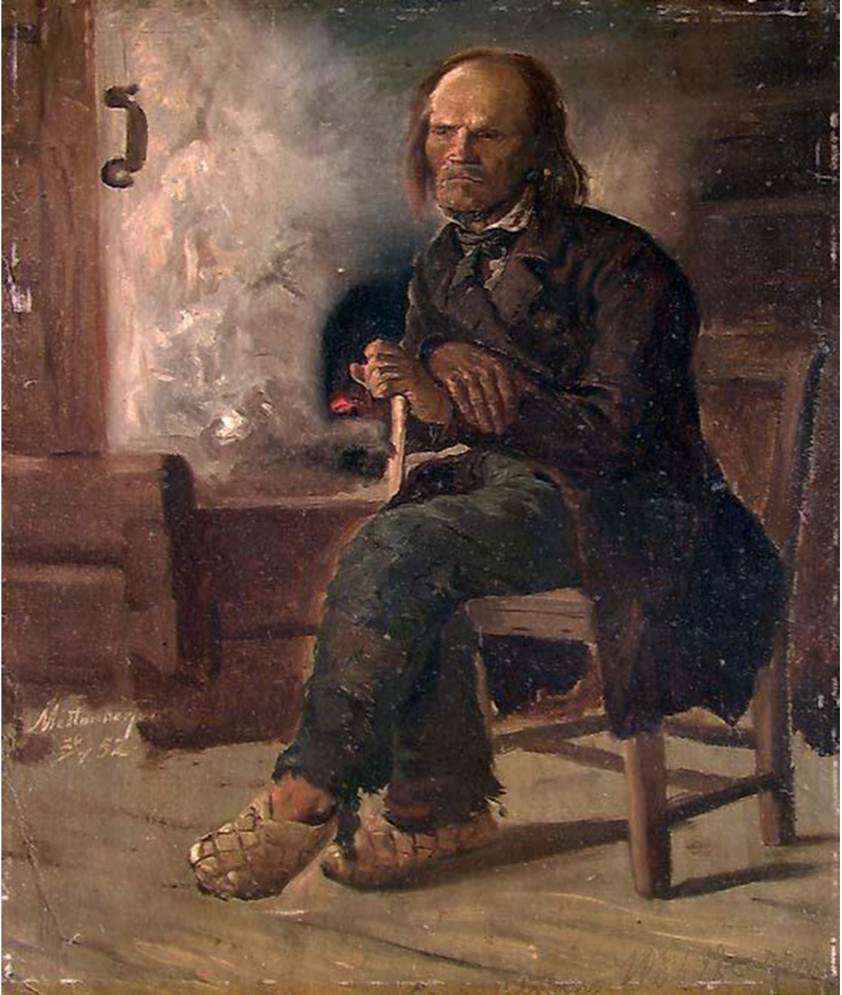
Mann fra Finnskogen i Värmland. Malt av Adolph Tidemand. Røykovnen kan ses i bakgrunnen.