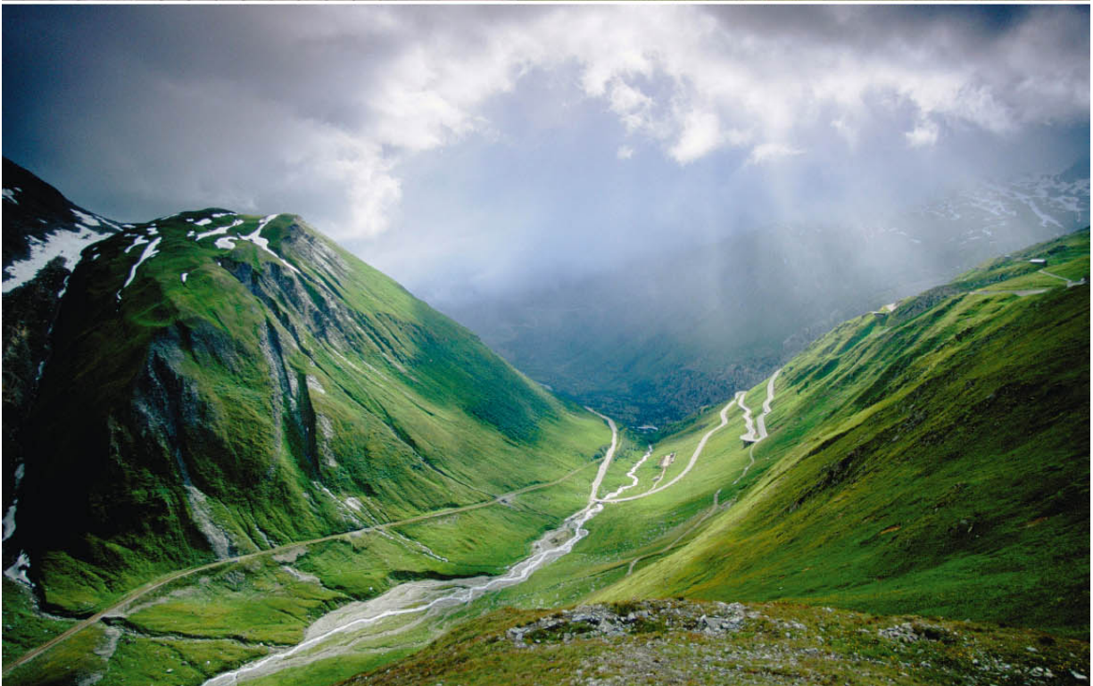
Riviera Garibaldi und Universitätspalast in Treviso (oben) und dramatische Wetterstimmung am Furkapass