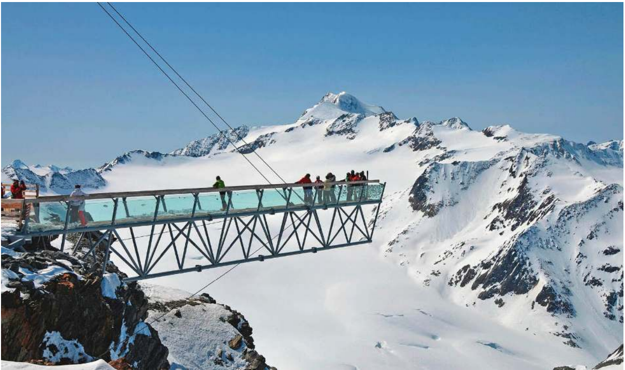
Spektakuläre Aussichtsplattform über dem Tiefenbachgletscher

Wer eine Fahrt in die Alpen vorhat, dem geht es im Prinzip wie Bergwanderern. Sie freuen sich auf ein schönes Urlaubserlebnis, das vor allem dann ein voller Erfolg wird, wenn man sich ein wenig darauf vorbereitet und wenn man sich vorher Gedanken macht, was man tun sollte und was nicht.