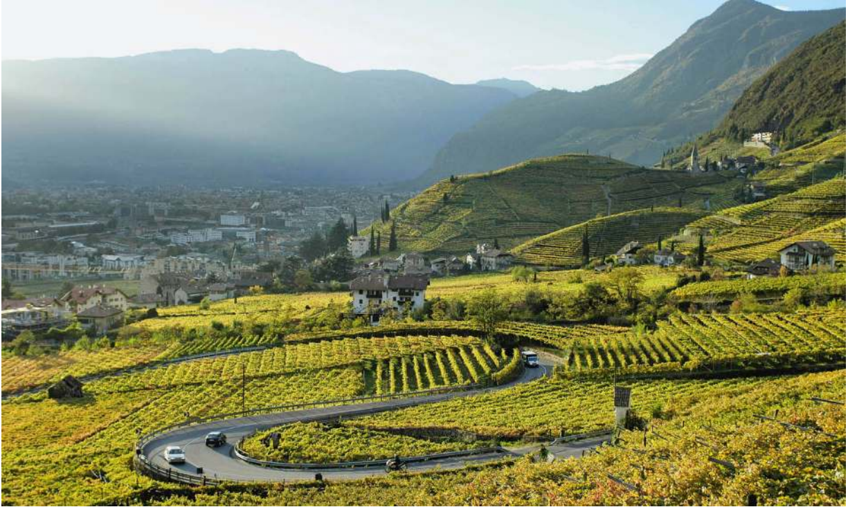
Blick auf Bozen im Herbst - mit Weingärten und dem Magdalenahügel