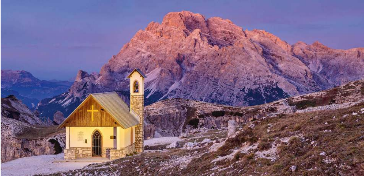
Kapelle vor dem Monte Cristallo in den Sextener Dolomiten

Egal wo man fährt, wichtig ist, dass man die Fahrtzeiten nur als Orientierungshilfe sieht. Nehmen Sie sich Zeit, bleiben Sie stehen, wenn Sie etwas Interessantes sehen und genießen sie die Fahrt unterwegs und denken Sie nicht andauernd daran, wann Sie ankommen werden. Besser, man setzt die Tagesetappen eher bescheiden an oder noch besser, man plant so gut wie gar nichts und fährt einfach drauf los.