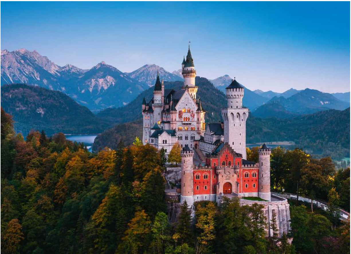
Neuschwanstein, das wahrscheinlich berühmteste Schloss in den Alpen

mit Blick auf See und Wallberg – und das alles fast kitschig schön.