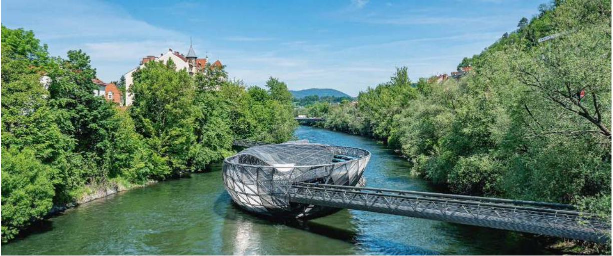
Die Grazer Insel in der Mur verbindet als schwimmende Plattform Kunst mit dem Erlebnis Wasser.