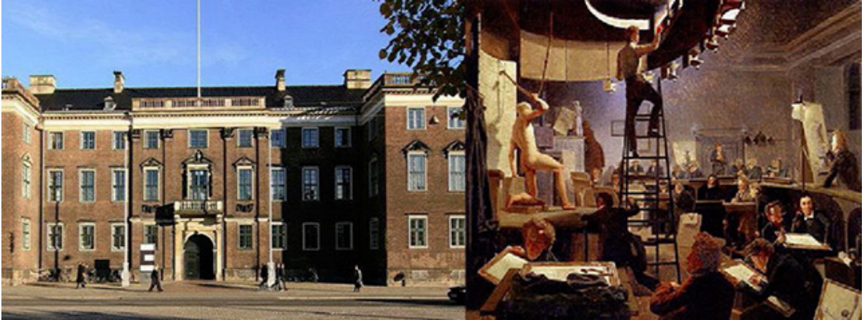
Kunstakademiet i København.