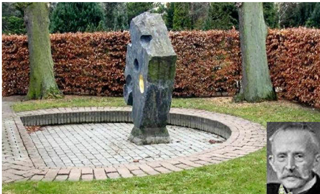
Peder Mørk Mønstedes gravsted på Garnisons Kirkegård.

prostatakræft og den 20. juni 1941 afgik han ved døden 81 år gammel. Peder blev kremeret den 25. juni på Søndermarks Krematorium og urnen nedsattes på Garnisons Kirkegård, hvor der også blev rejst et mindesmærke for maleren, som dog senere blev nedtaget igen.