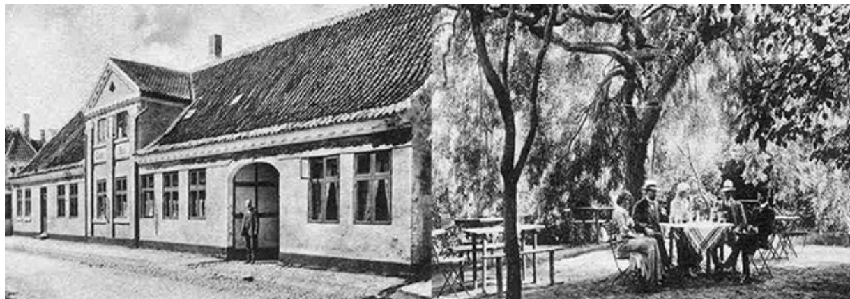
Clasens Hotel i Sæby

den 15. juni 1896 og Tage den 26. december 1899. Georg Otto døde dog ca. 4 måneder efter fødslen den 9. oktober som følge af indre blødninger. Ved folketællingen 1901 blev det således også rigtigt angivet, at parret havde fået 5 børn, hvoraf de 3 var levende.