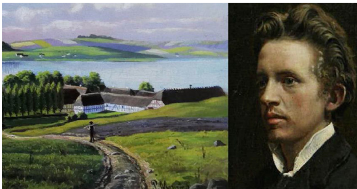
1875. Fævejlegård ved Kolindsund.