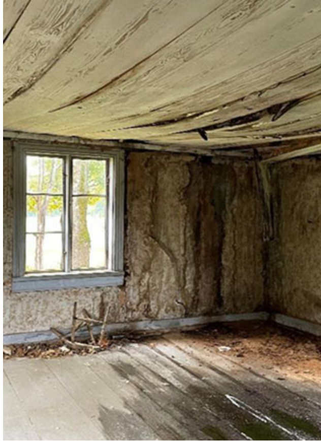
Taket läcker som ett såll numera.

Det är minst 40 år sedan någon bodde i det här huset, här får gårdstomtarna härja vilt numera men de är ju måna om huset och de små trollen håller tomtarna i schack för det mesta! Jag är övertygad om att skulle man komma på besök en natt så skulle man säkert få sällskap av de små varelserna, kanske skulle de berätta ett och annat.