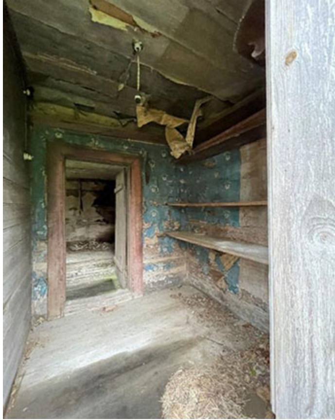
Rejält skafferi. Den gamla tapeten är lite trasig...men glödlampan i taket är hel.