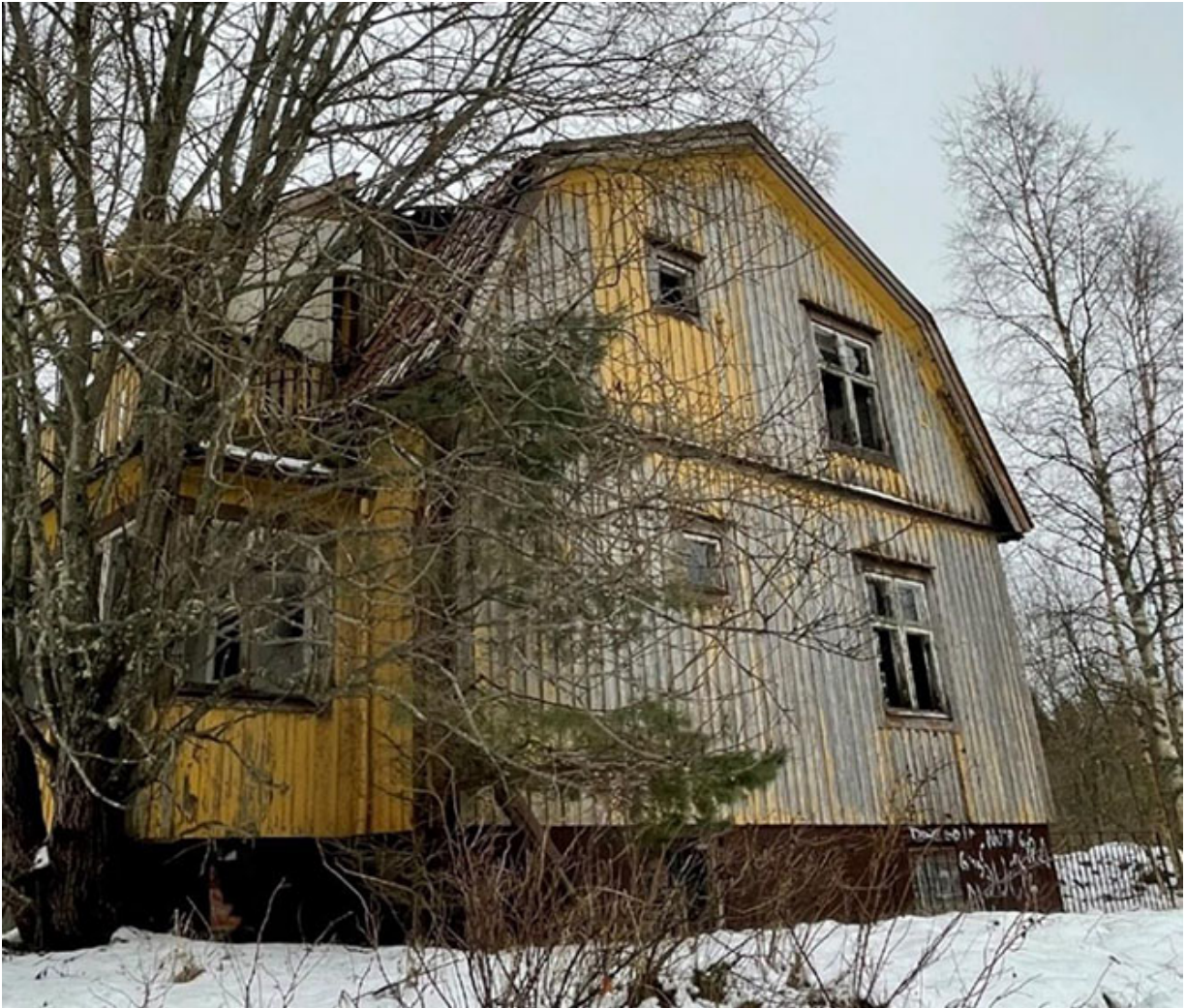
Södergaveln har tagit stryk av regn och vind.

Men finns det några spår av människorna som bodde här, svaret är ja!