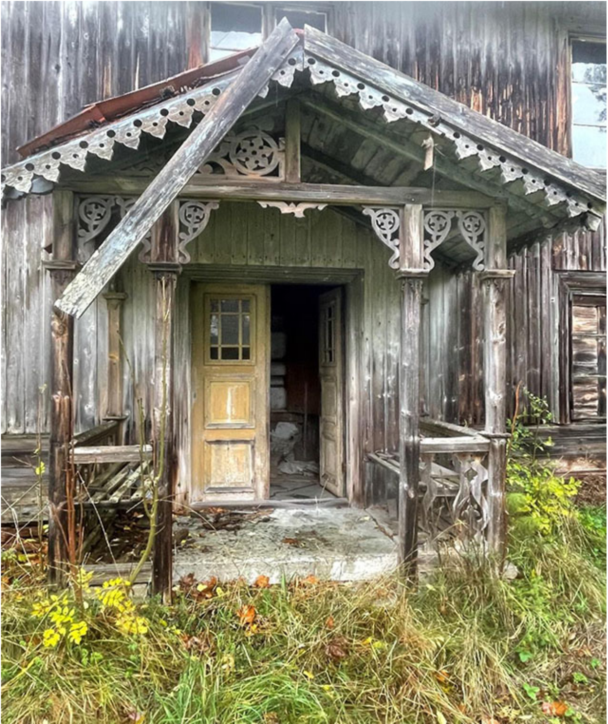
En underbar veranda en gång i tiden. Titta på de vackra dörrarna liksom all den fina snickarglädjen.