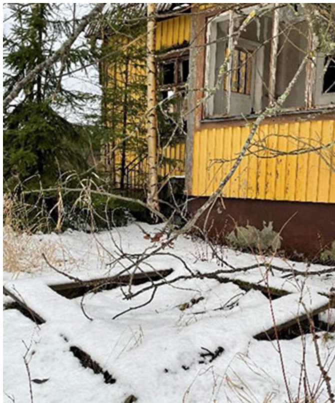
Sandlådan framför verandan.

I västerläge finns den gamla verandan med mycket glas, där har säkert många koppar kaffe druckits i skenet från kvällssolen. Här hade man också fin överblick över barnen som lekte i sandlådan framför verandan, sandlådan finns ännu kvar!