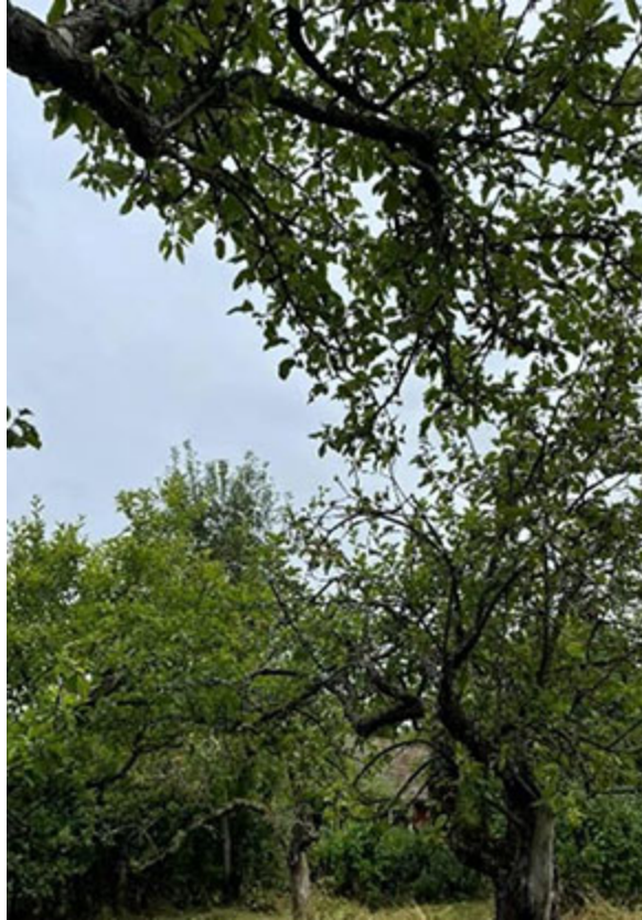
Några av de ca 100 äppelträden.