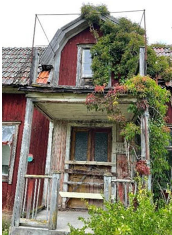
Oj så fint det säkert var en gång.