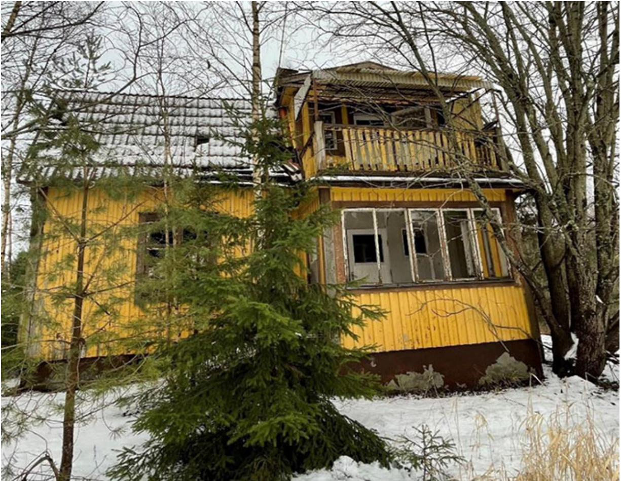
Huset vid stupet, läskigt på flera sätt.....öde sen 40 år.

Vi hade från stora vägen flera gånger sett gaveln på ett gammalt spökhuis hösten 2021, så en dag åkte vi in en liten väg och hittade snabbt en gammal öde ladugård med loge men hittade inget hus, vi åkte runt en gång till men med samma resultat, såg ju för tusan huset från vägen men hittade sen ingen väg dit och en sådan måste ju finnas! Men