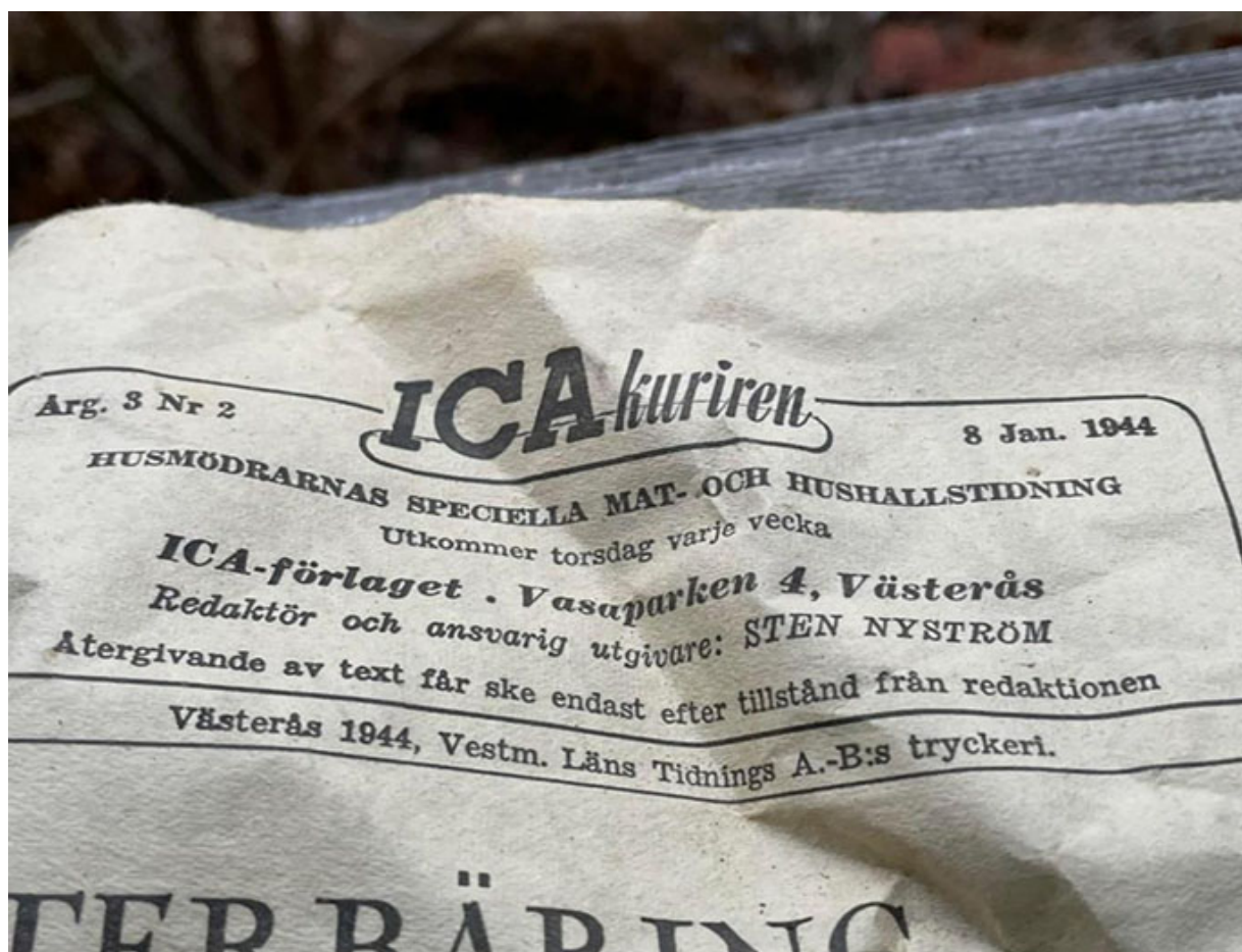
ICA-Kuriren nr 2, årgång 3, 8 Januari 1944.

Jag hittade i entrén på detta gamla hus en tidning, en ICA-kuriren från 8 januari 1944, alltså från andra världskrigets dagar.